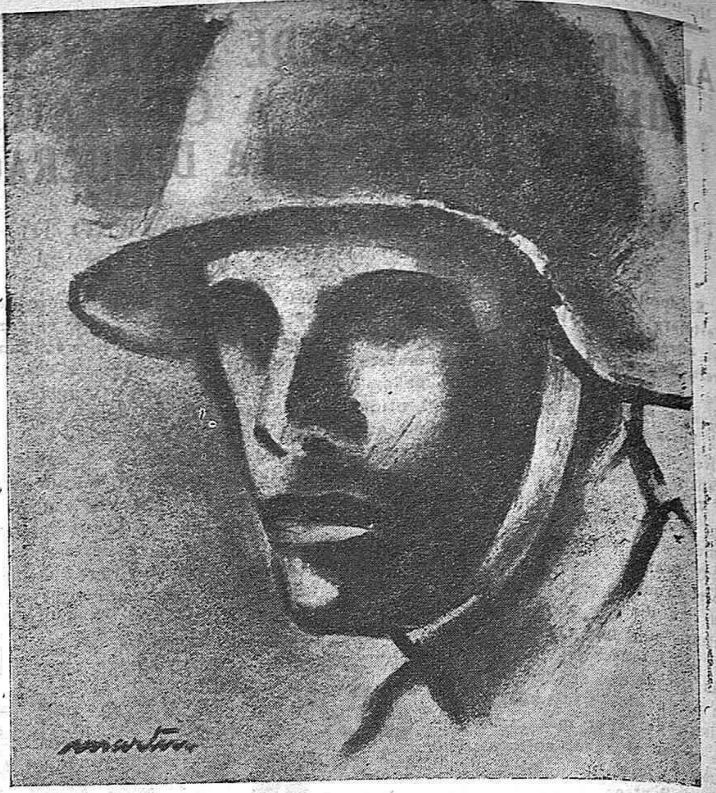
MILICIANO por VICENTE MARTIN

Arriba hay una comba de azuleros, también plana, agachada; las sillas de una comodidad inverosímil, tiene por su parte igual característica: todo es allí como cohibido, de estar sobre la tierra... El padre de Rafael Barradas paño.