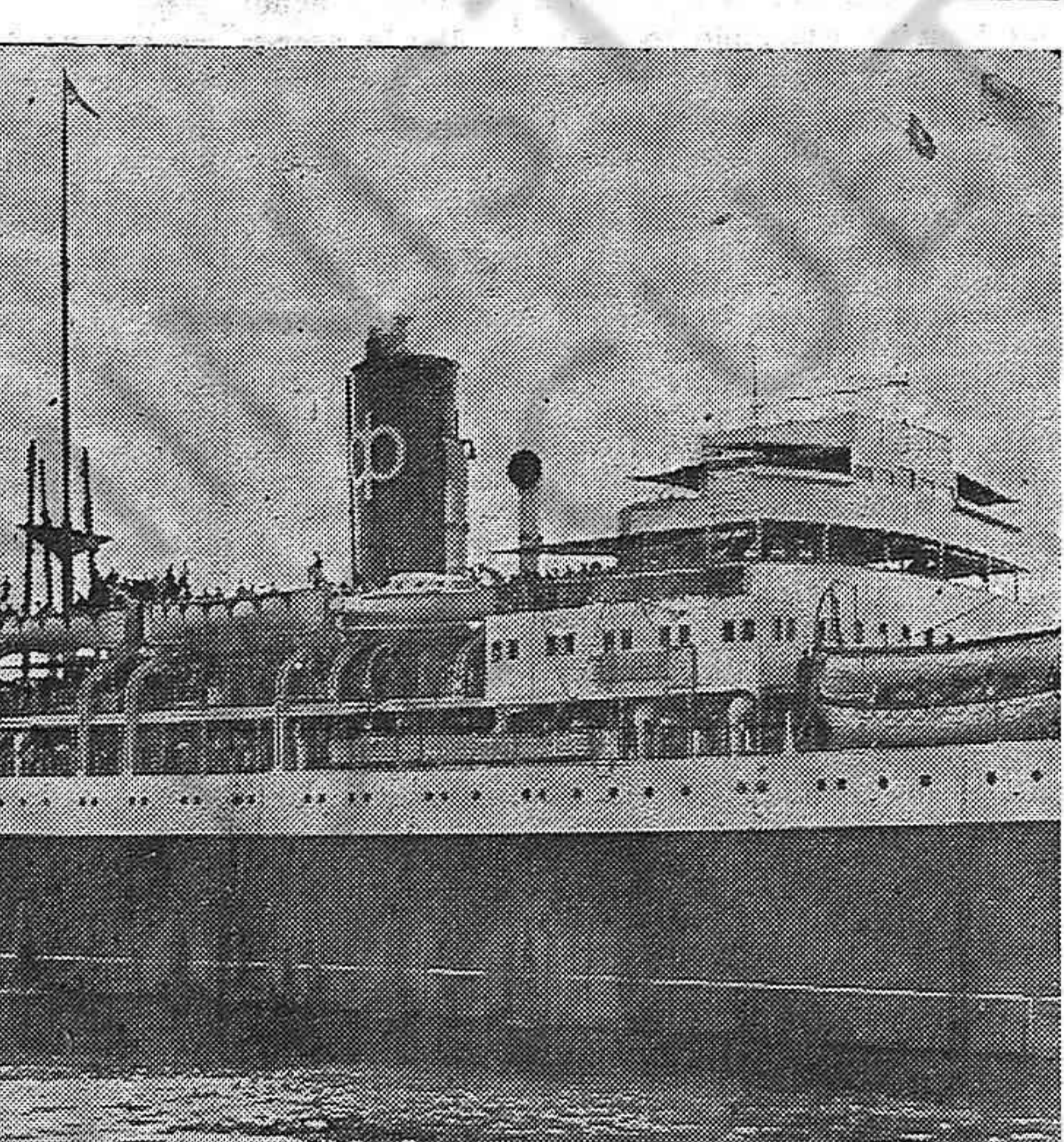
EL DIA 3 DE ESTE MES hizo un año que el "WINNIPEG" zarpaba del puerto de Pauillac-Bordeaux, rumbo a Chile, con 2.150 refugiados españoles liberados de las torturas y los horrores de los campos de concentración, gracias a la solidaridad argentina, uruguaya y chilena y a la cooperación del S. E. R. E. Aquella gesta magnífica tiene que verse hoy multiplicada. Solo así será una realidad la salvación de los refugiados que hay en territorio francés.