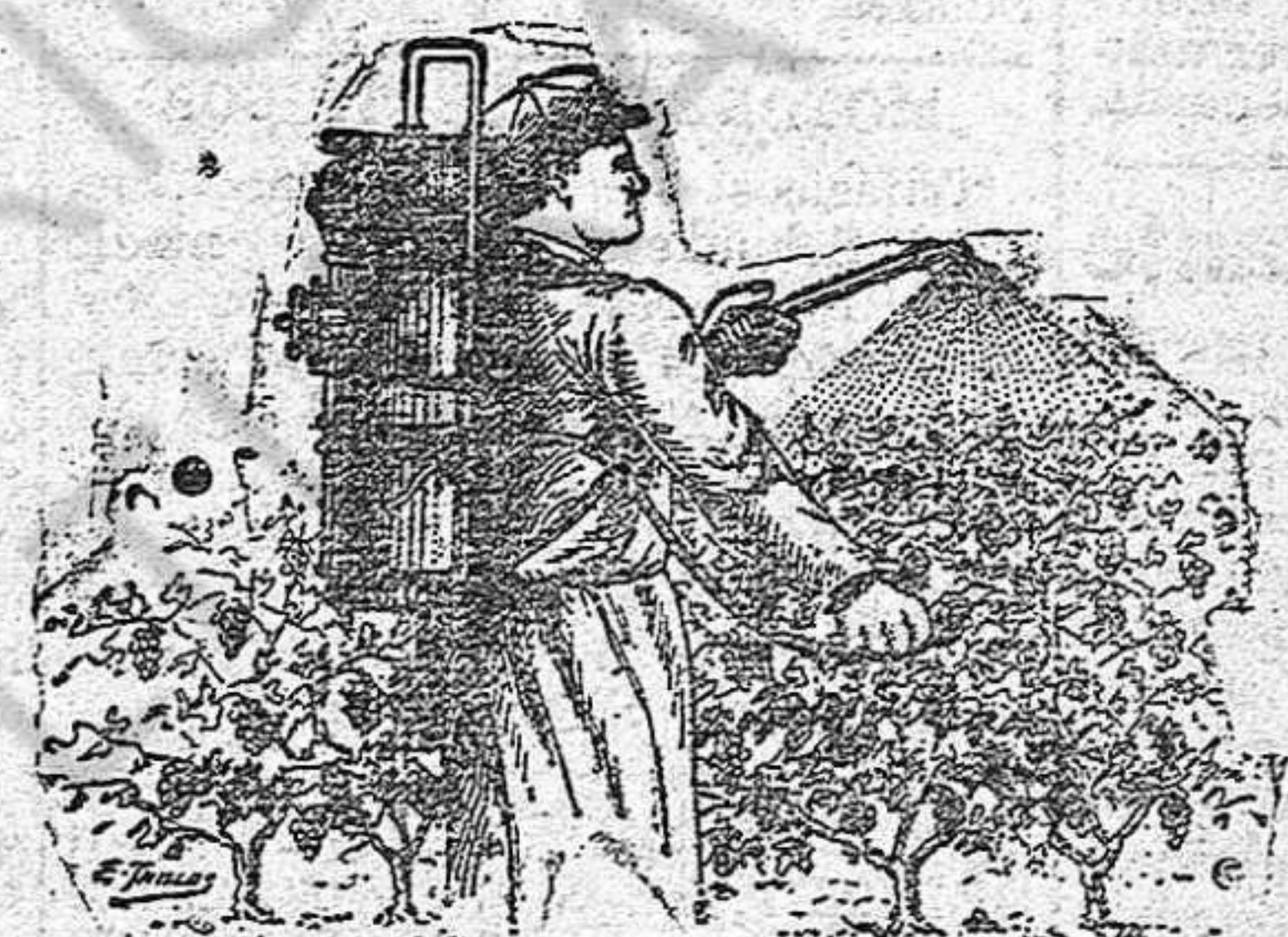
Viñedos tratados con el "Sulfatizador Líquido"

BASTAN 2 o 3 PULVERIZACIONES CON «SULFATIZADOR LIQUIDOCASAMAJO» PARA TENER SANOS Y SALVOS DE TODA PLAGA QUE DEVASTA «VINEDOS, PARRALES, ARBOLES y HORTALIZAS»