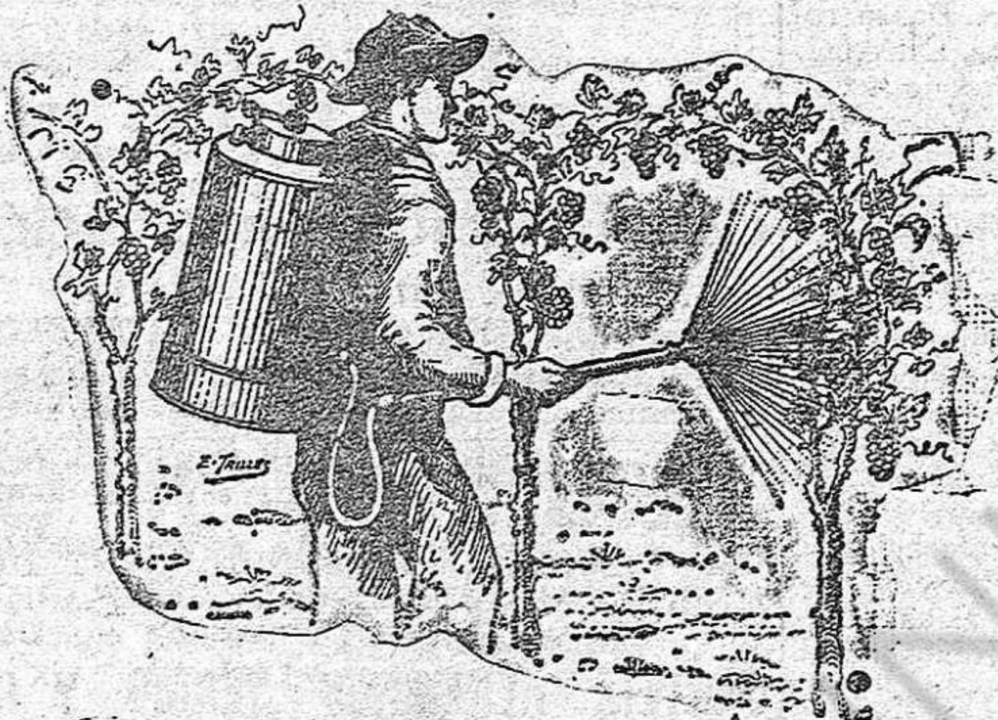
Parrales tratados con el "Sulfatizador Líquido Casamajo"