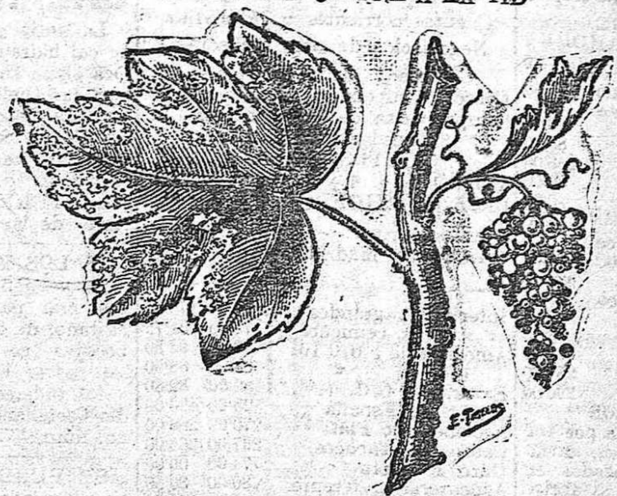
Viñedo con dos tratamientos de sulfato de cobre