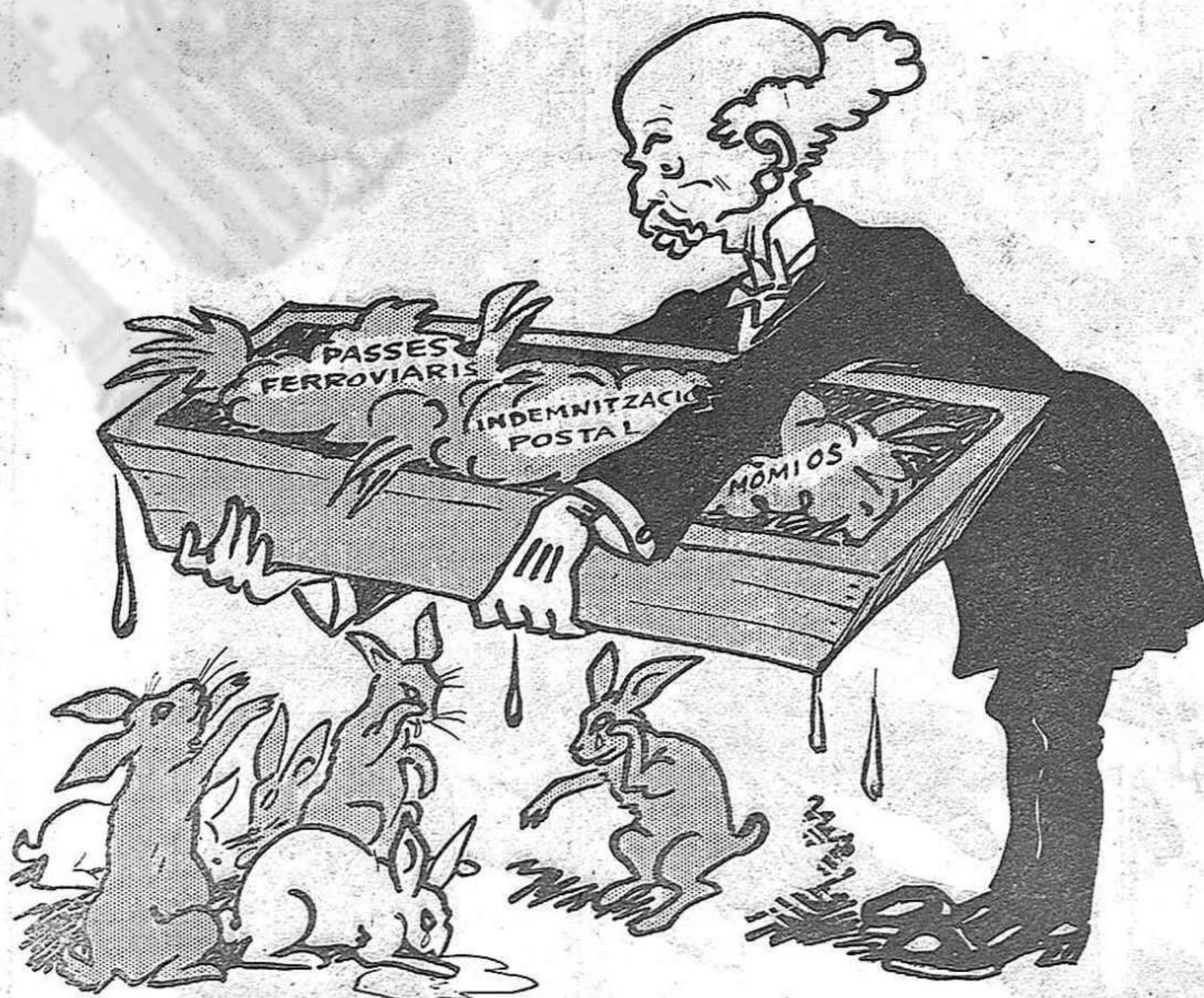
—Ara, amb la Dissolució, ens han tret la racció!...