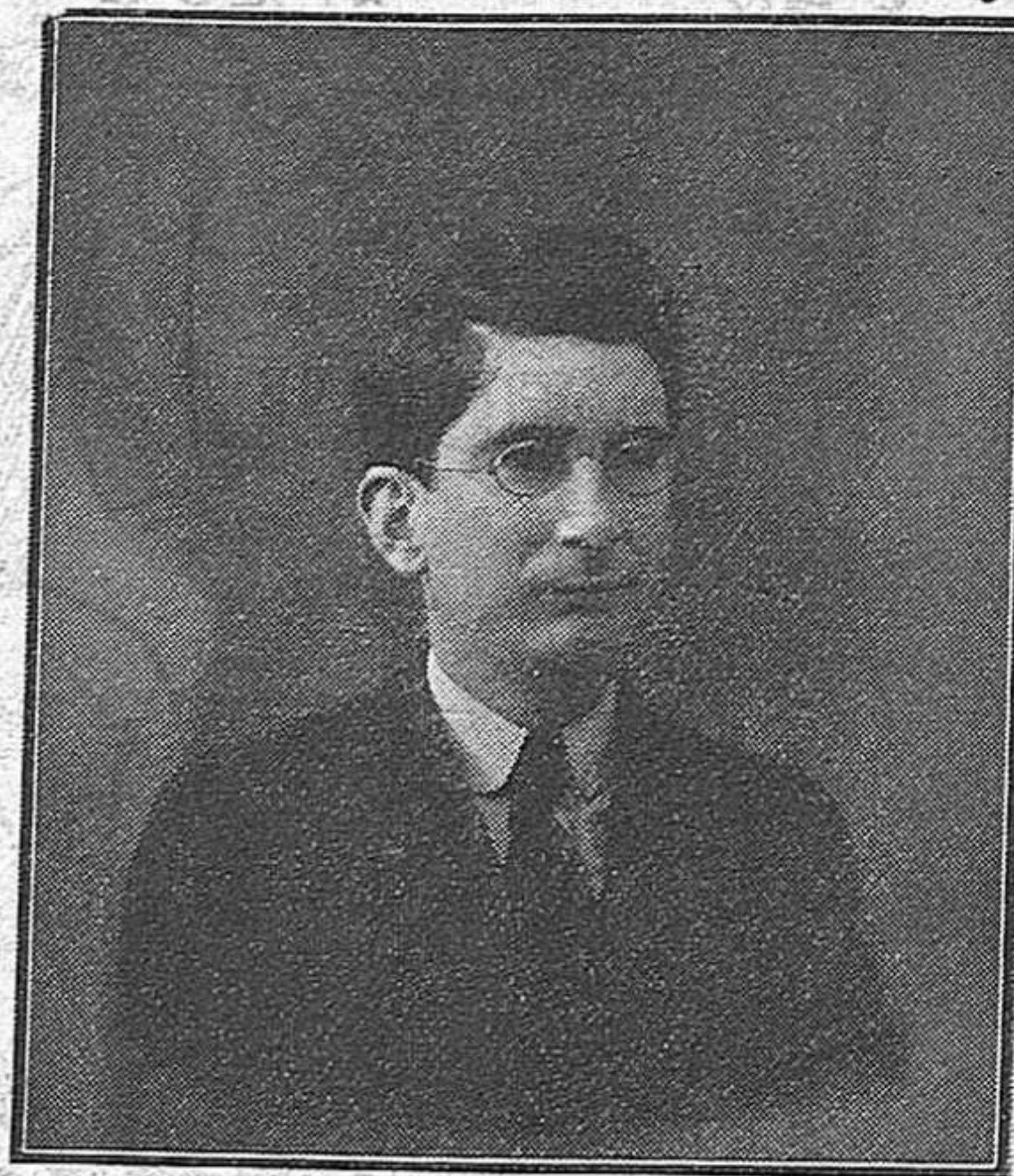
Don Marcellí Domingo

eminent publiciste i popular diputat a Corts per Tortosa