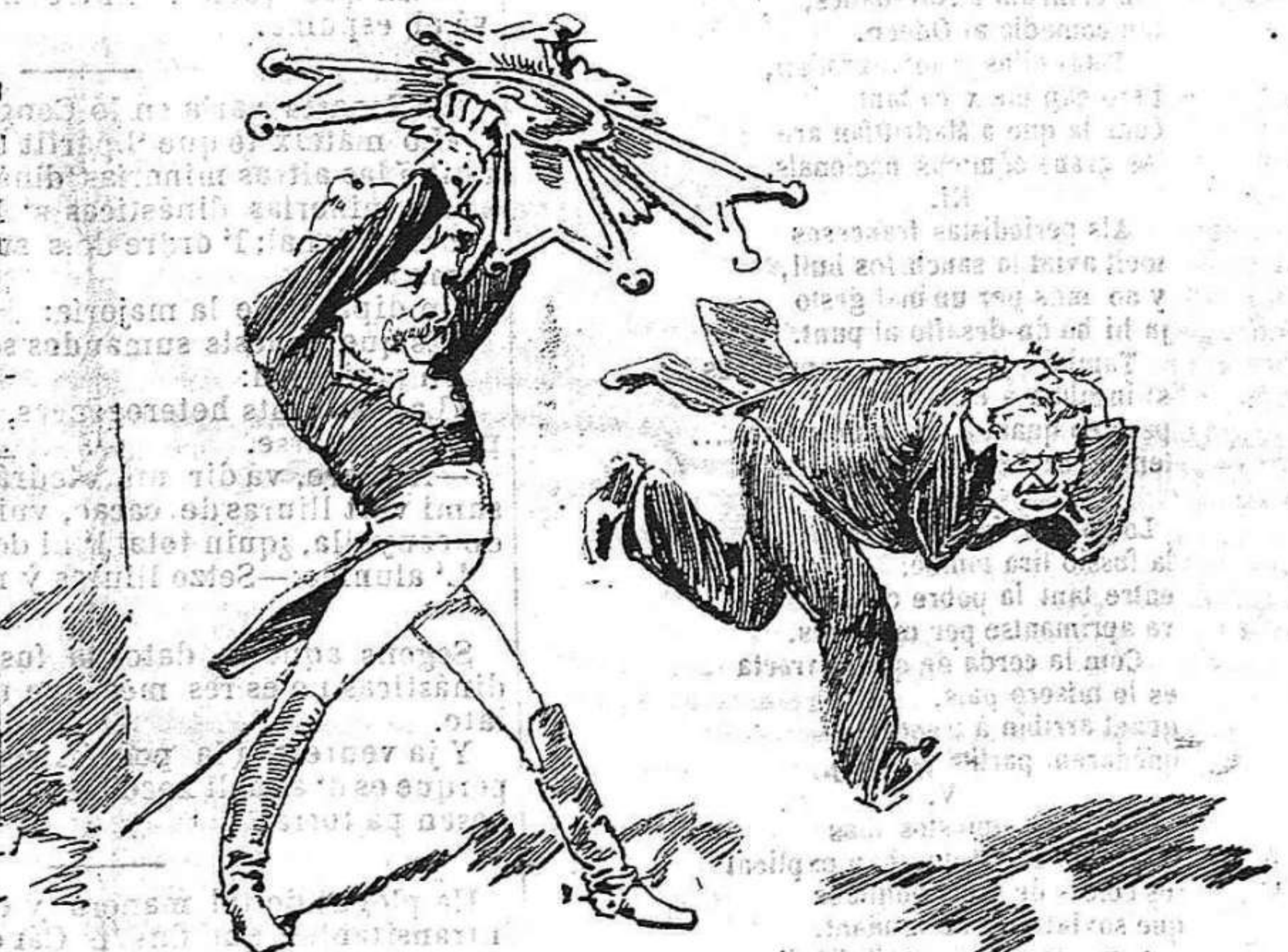
«Si S. S. me hubiese dado esta cruz, yo se la arrojaría á S. S.»