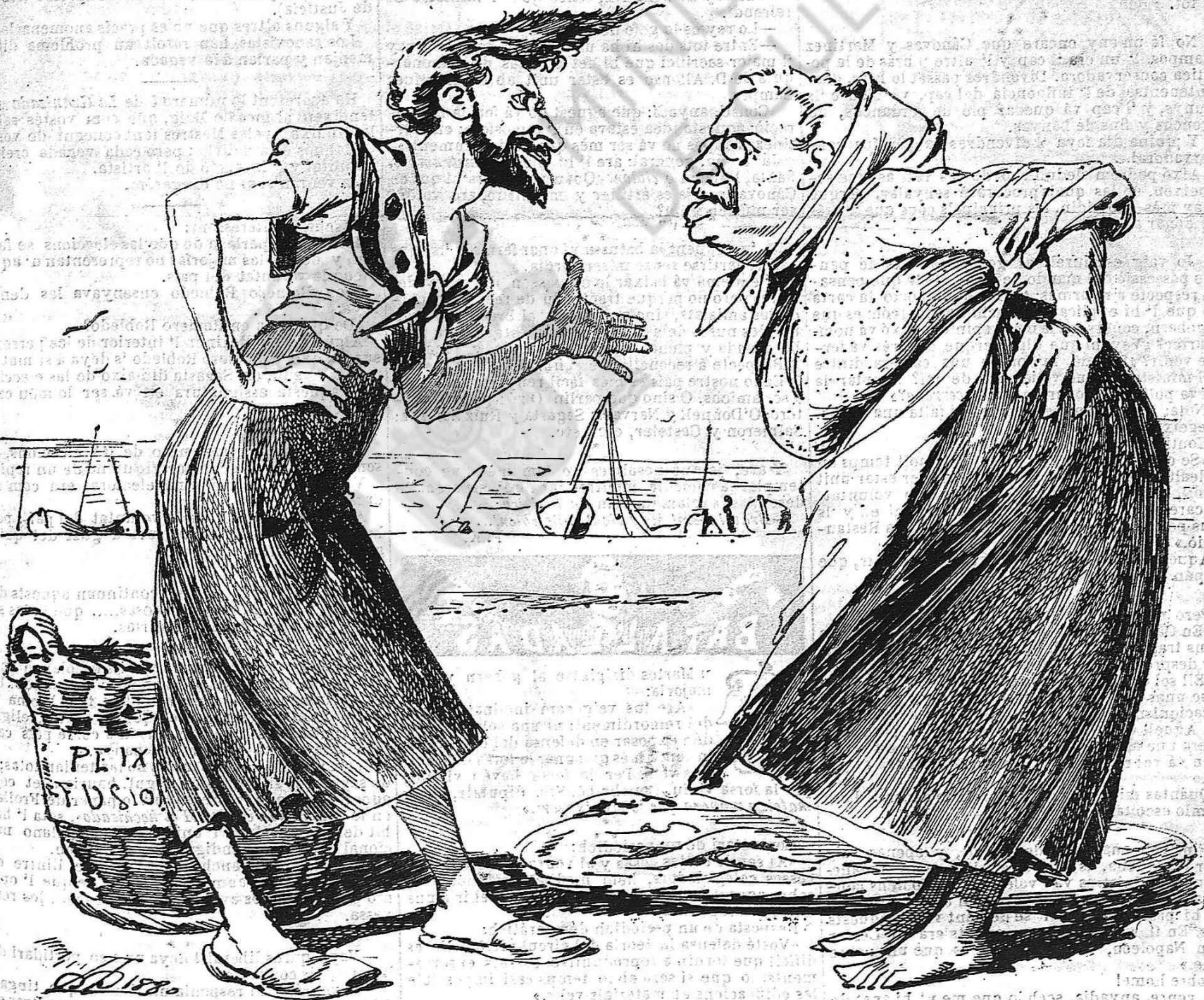
L' Antonia:—¡Niño!... La Práxedes:—¡Feto!