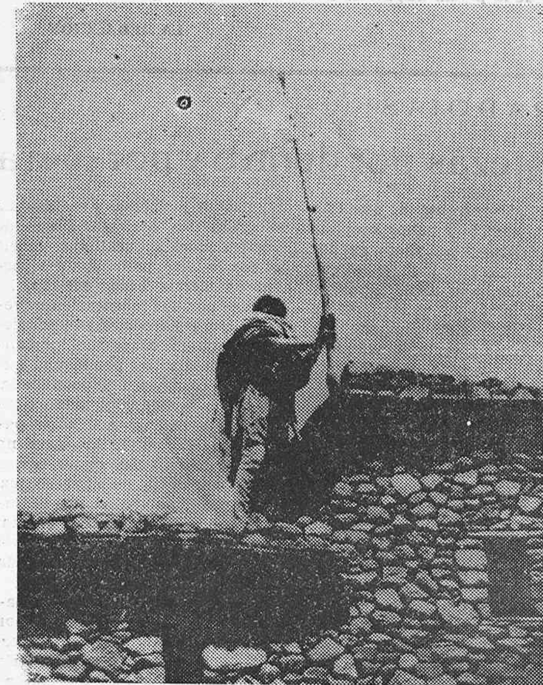
Un soldado etiope colocando la bandera blanca para demostrar el rendimiento del pueblo a los italianos, entre Adigrat y Makalé.