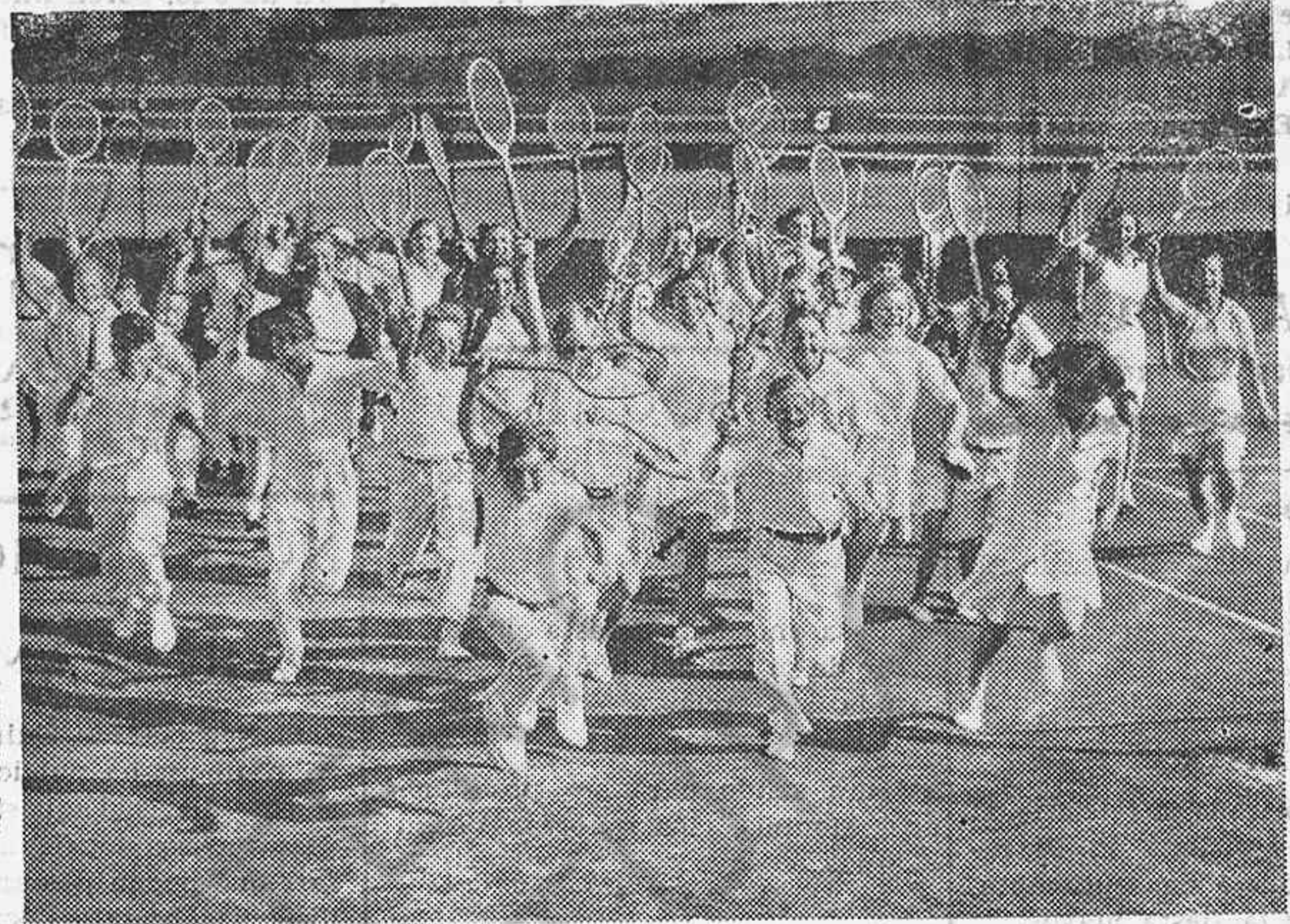
El campeonato anual de Laun - Tenis americano tuvo lugar en un la'neario inglés de Trinton. Los jóvenes competentes, llegando alegremente para tomar parte en el match.