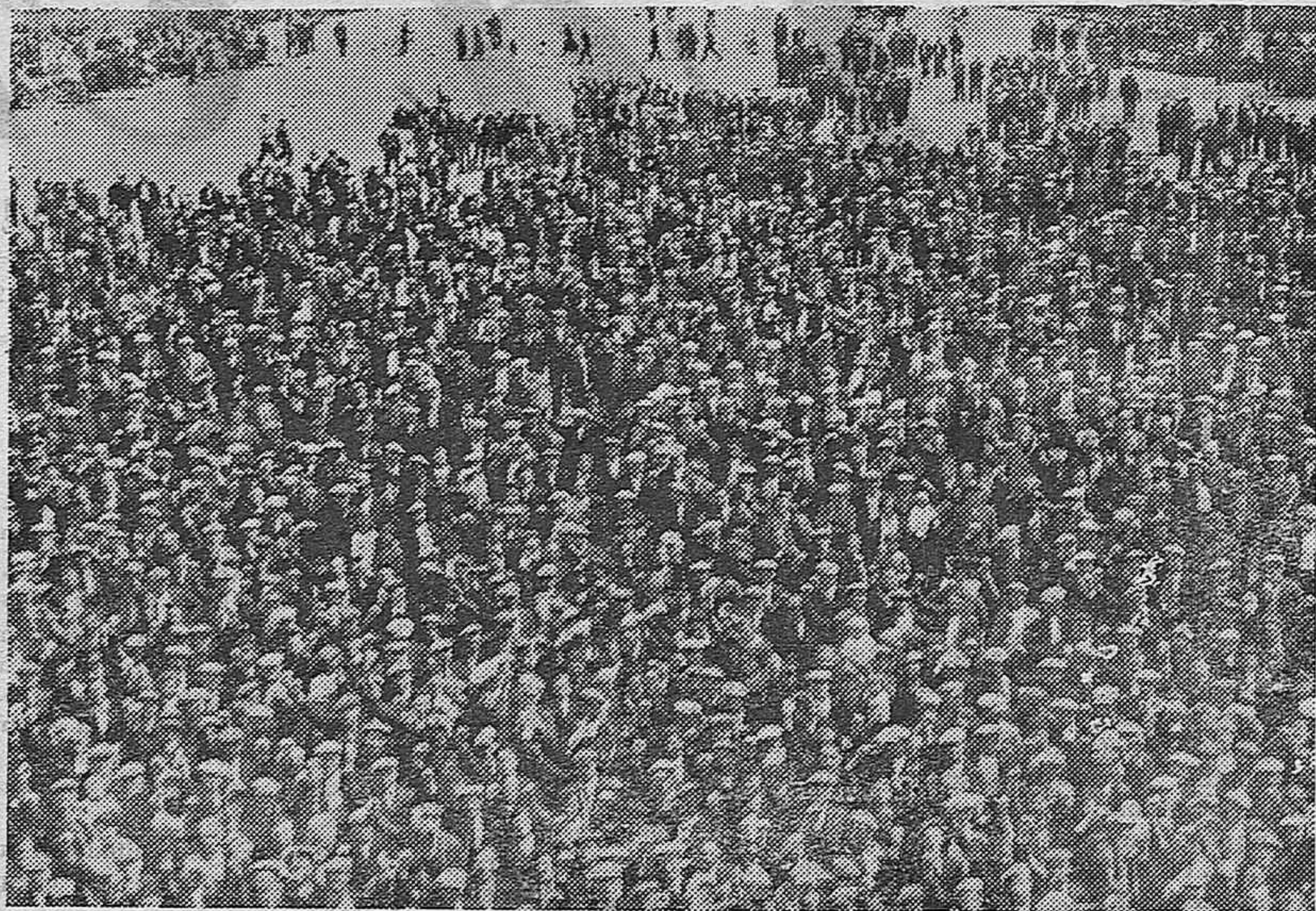
Obreros de la fábrica de Marles-Les-Mines enterándose que sus bases de trabajo han sido aceptadas y que desde hoy tienen que reintegrarse a sus puestos.