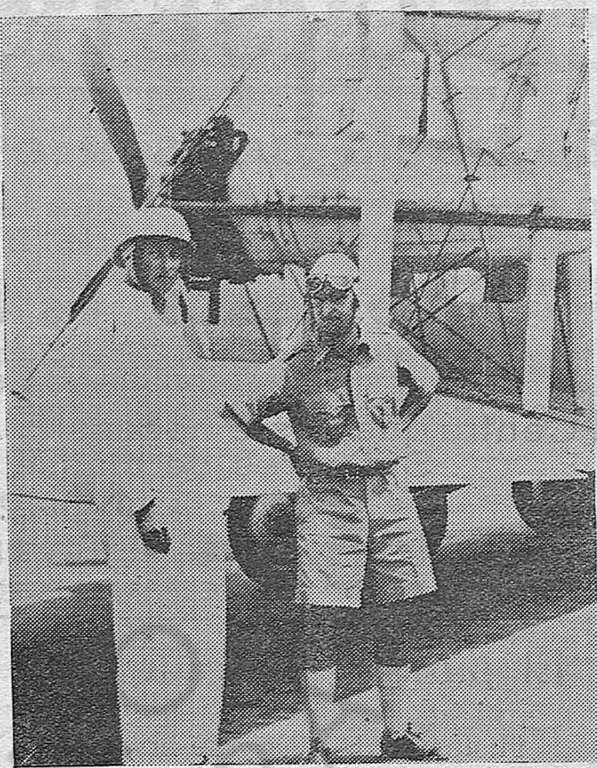
Von Stehrer, el embajador alemán en el Cairo que fue salvado por un aeroplano militar inglés después de pasar muchos días perdido con su auto y su mecánico en el desierto. El embajador (izquierda) con el avia dor que le salvó, a su llegada al aeródromo del Cairo.