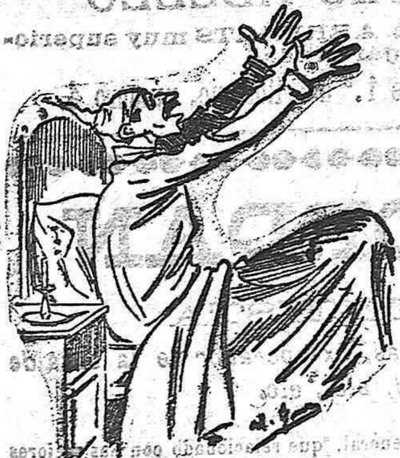
El despertar cotidiano