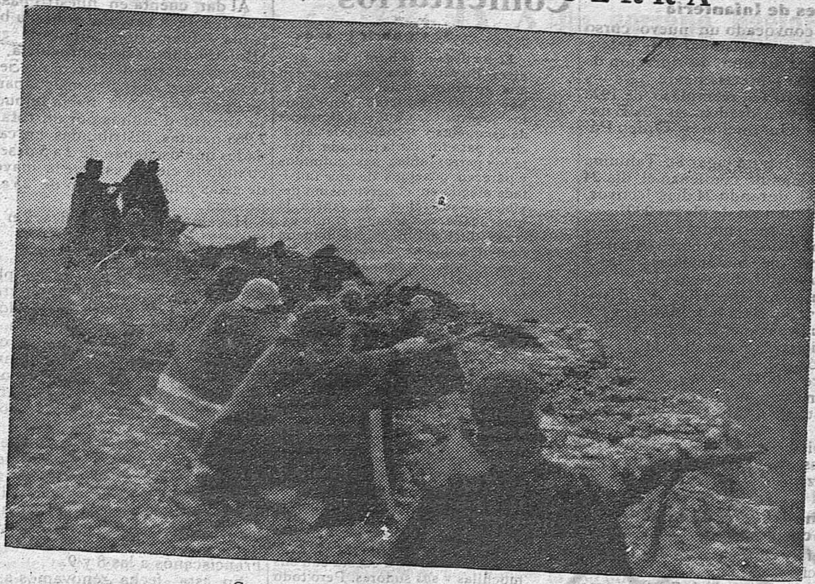
Grupo de infantes batiendo las posiciones rojas

La población civil se alimenta casi exclusivamente de tomate, y en medio de este cuadro de terror actúan y viven opíparamente los dirigidos rojos, que son, según la moral bolchevique, los únicos que tienen derecho a la vida.