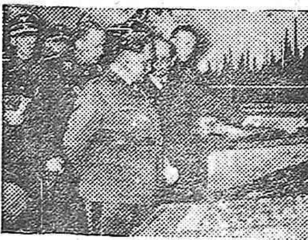
Goering y su Estado Mayor

Berlín, 10 (a las 23,20).—El Mariscal del Aire Italo Balbo ha sido hoy al mediodía, huésped del Maris-