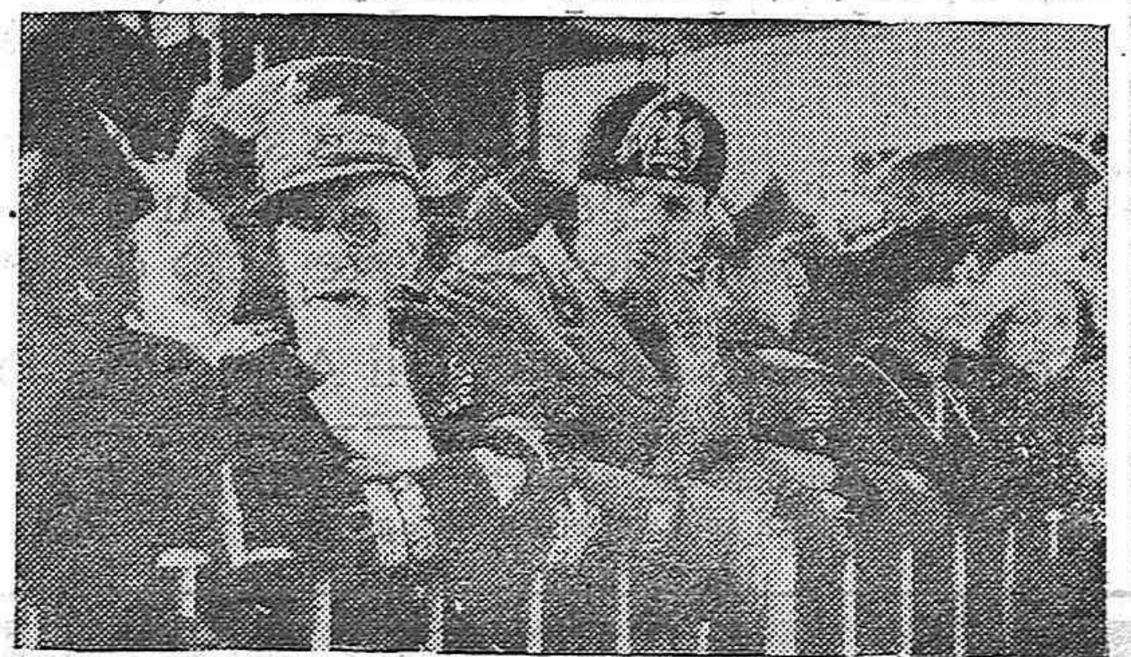
El mariscal E. Bono, el ministro Ciano y el ministro secretario presentando un festival.

Se estima que dichas Comisiones estarán en España antes de fines del corriente mes.