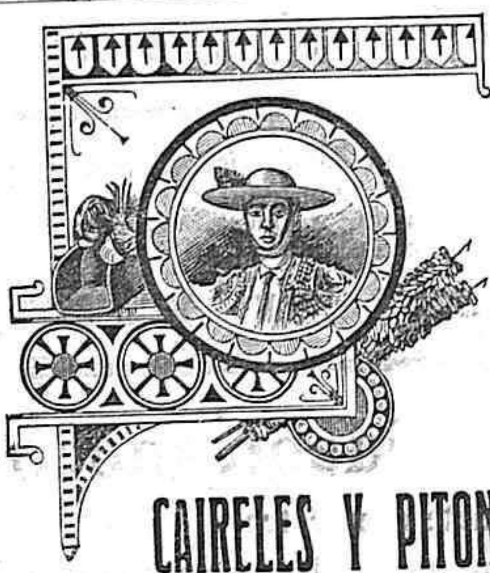
CAIRELES Y PITONES

los Somatenes de esta villa oirán mañana misa en la ermita de la patrona de este pueblo Nuestra Señora de la Antigua; firmarán las listas de adhesión al Monarca, se obsequiarán con un refresco en la tarde y celebrarán un baile en el Club "El Recreo". El Corresponsal. 16 mayo 1927.