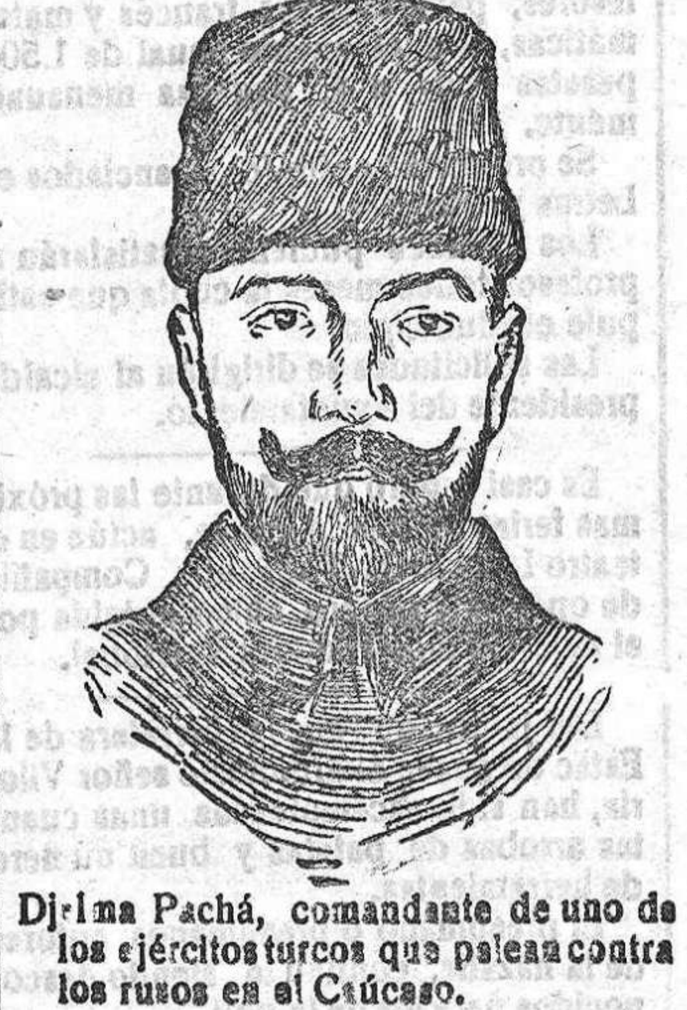
Djama Pachá, comandante de uno de los ejércitos turcos que pisean contra los rusos en el Cáucaso.