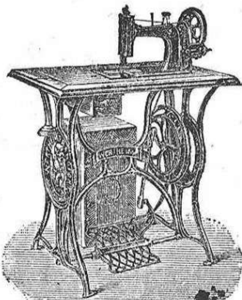
Las que más se garantizan.