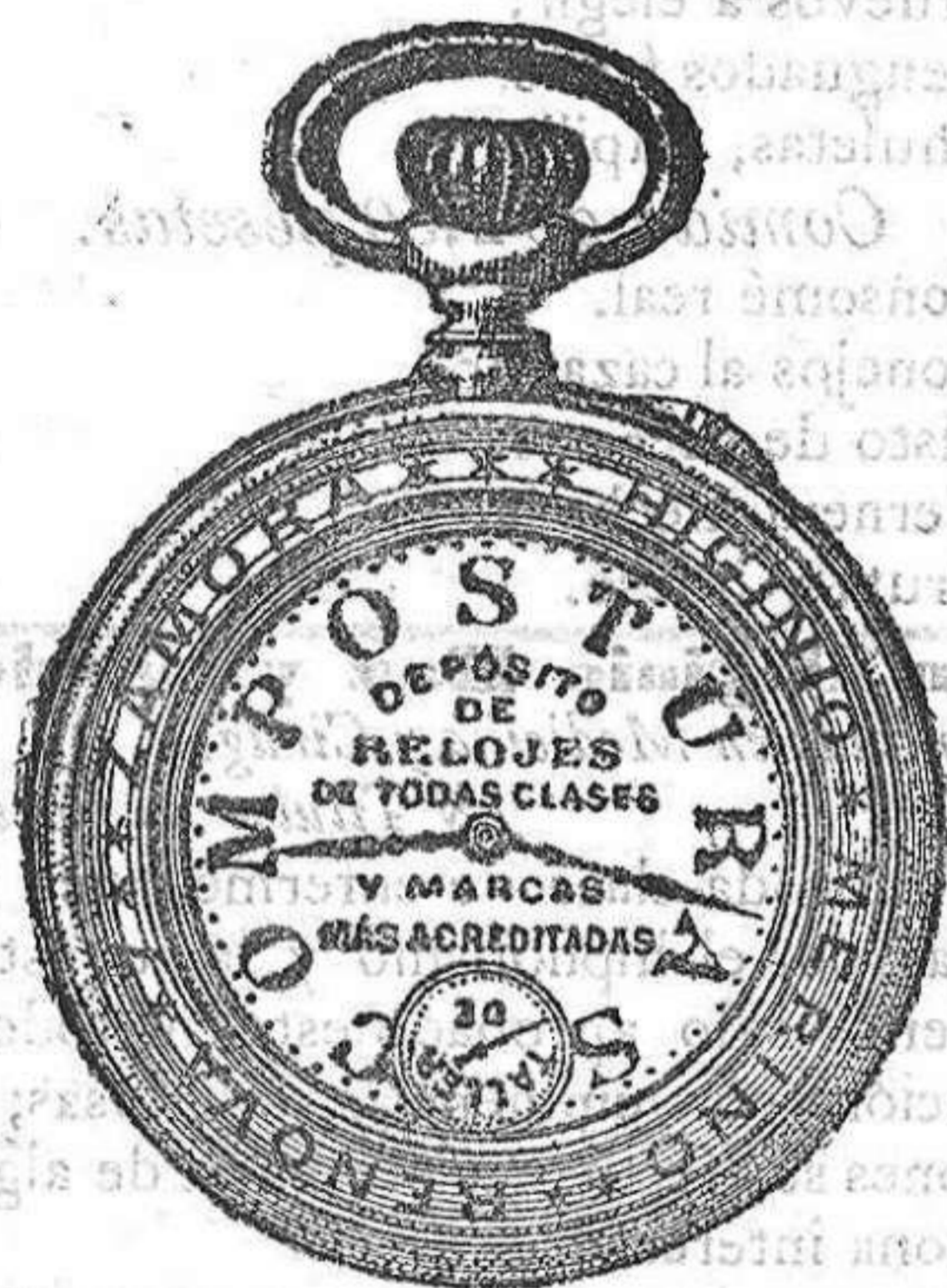
Relojes Mored, péndulos.