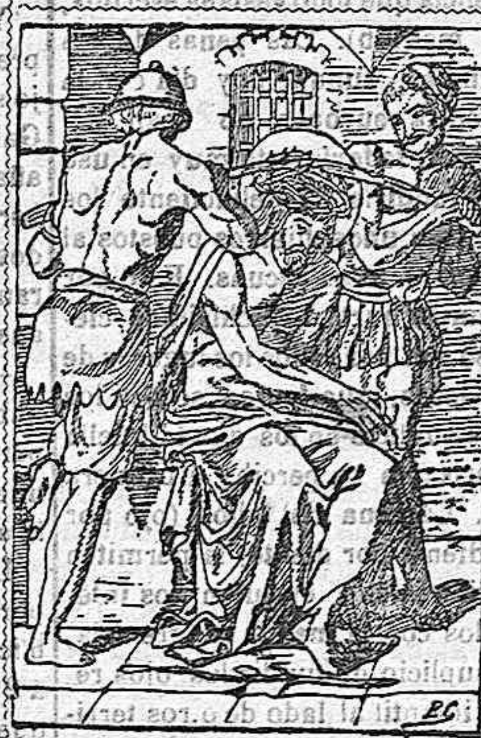
(De un grabado de Alberto Durero.)

Ermita perdida en las arrugas de la sierra parda, más allá del robledal, cercana al río, en la faja del risco, bajo la luz del sol que la envolvía y se adentraba por las ventanas amplias y pintaba con llamas de oro el rostro renegrido de los santos, y se hacía ergía de chispas brillantes al encontrar la plata de la custodia y el pulido cristal de las lámparas votivas; ermita acogedora con su paz interior, en la que el sahumero del incensario saturaba la atmósfera de perfumes de Oriente; incienso y mirra; ermita de evocación, de una leyenda mística y piadosa; era todo un prodigio de luz y de música, en su resucitar, al tiempo que al descorrerse los paños funerarios, descubrían la faz livida y extenuada del Cristo Milagroso, y los rapaces, oficiando en prácticas más de pagania que de religión, irrumpían en el templo, armados de colleras encampanilladas y cascabeleras, ensordeciendo los oídos piadosos.