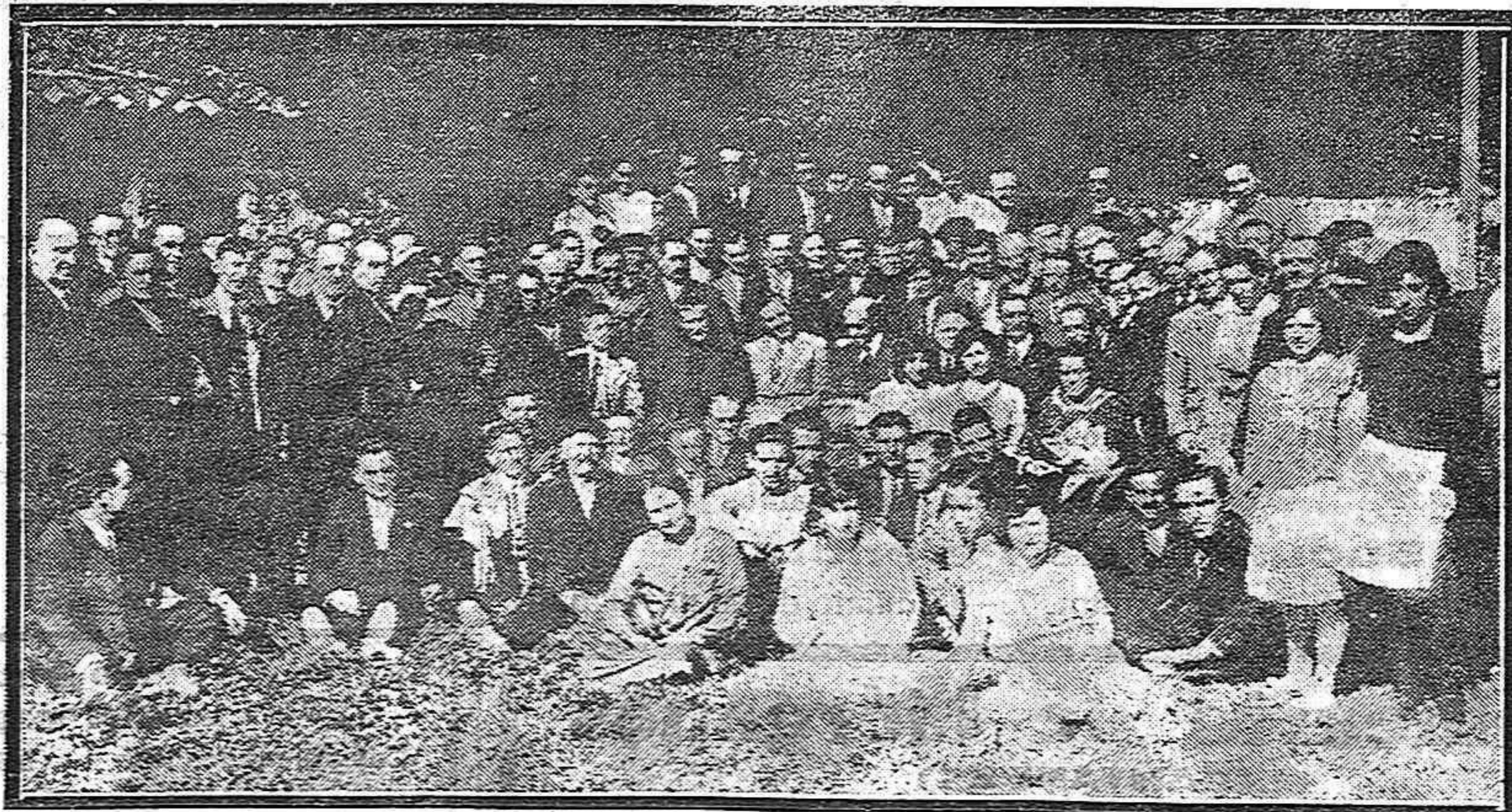
Asistentes al banquete organizado por la Colonia Palentina con motivo de la constitución de la misma en Santander

PROPIEDAD DE LA FEDERACION CATOLICO-AGRARIA