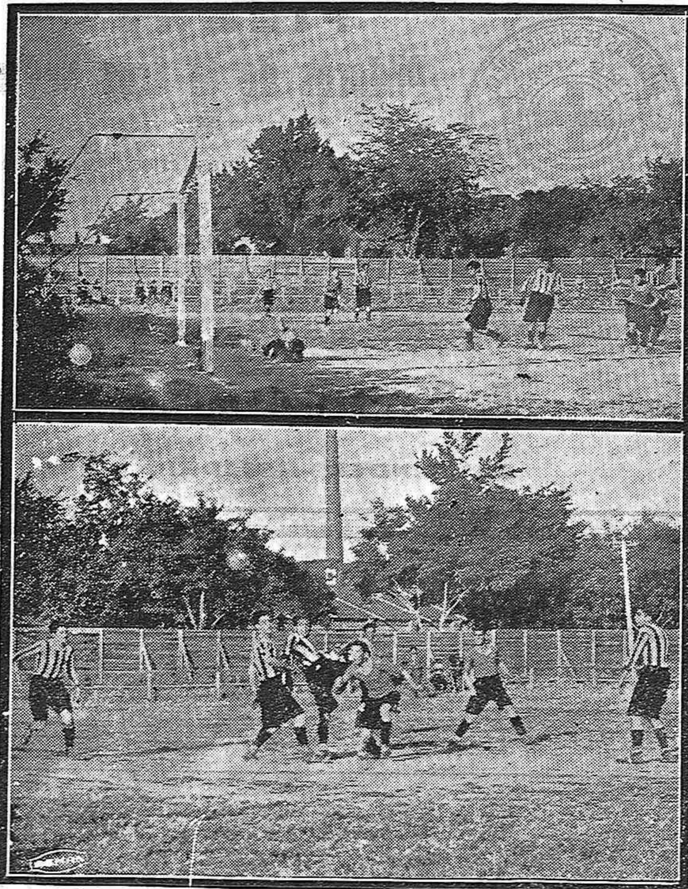
DEL PARTIDO DEL DOMINGO.—Uno de los tantos marcados por el C. D. Palencia (Abajo) Una interesante jugada

En la Bolsa de París se han facilitado las siguientes cotizaciones oficiales: Francos, 34'15; Libras, 42'08 y dólares, 8'65.