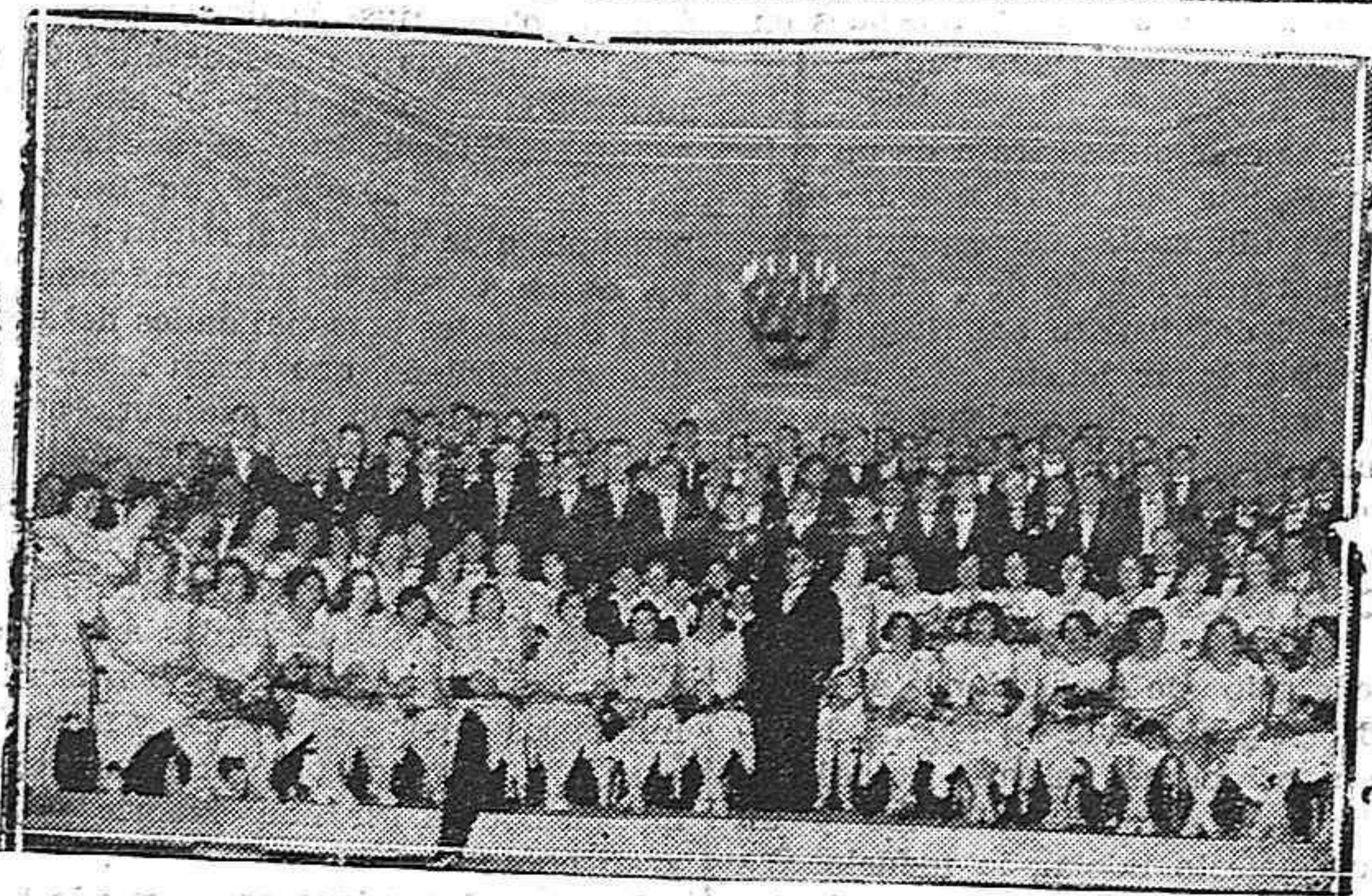
Nuestra coral en el magnífico escenario del teatro Calderón, de Valladolid.

Madrid.—En la Dirección general de Corporaciones, presidiendo el señor Mariatega, constituyóse la Cámara de Seguro del Campo, institución que sustituirá en sus funciones a la antigua Mutualidad del Campo.