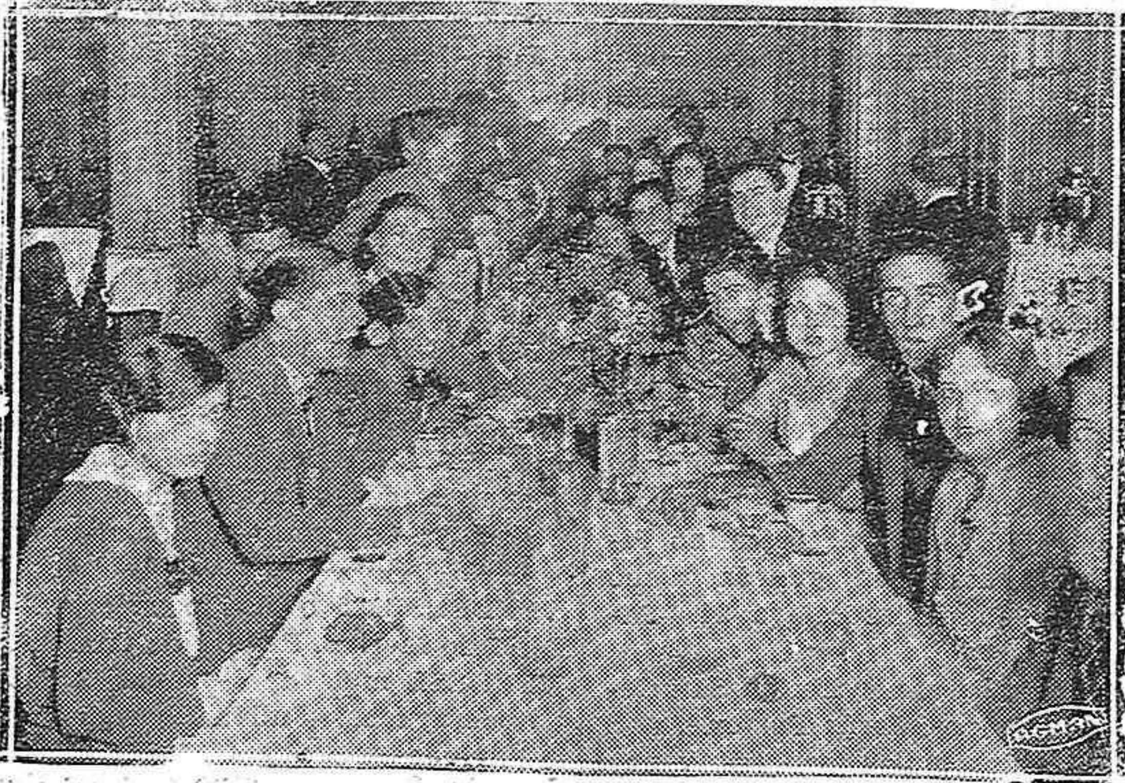
Un aspecto de las mesas de coralistas en el banquete del Hotel Inglaterra.

Tokio.—La Delegación japonesa, que participará en los trabajos de la Conferencia del Desarme naval, embarcará el día 30 de noviembre en el puerto de Yokohama.