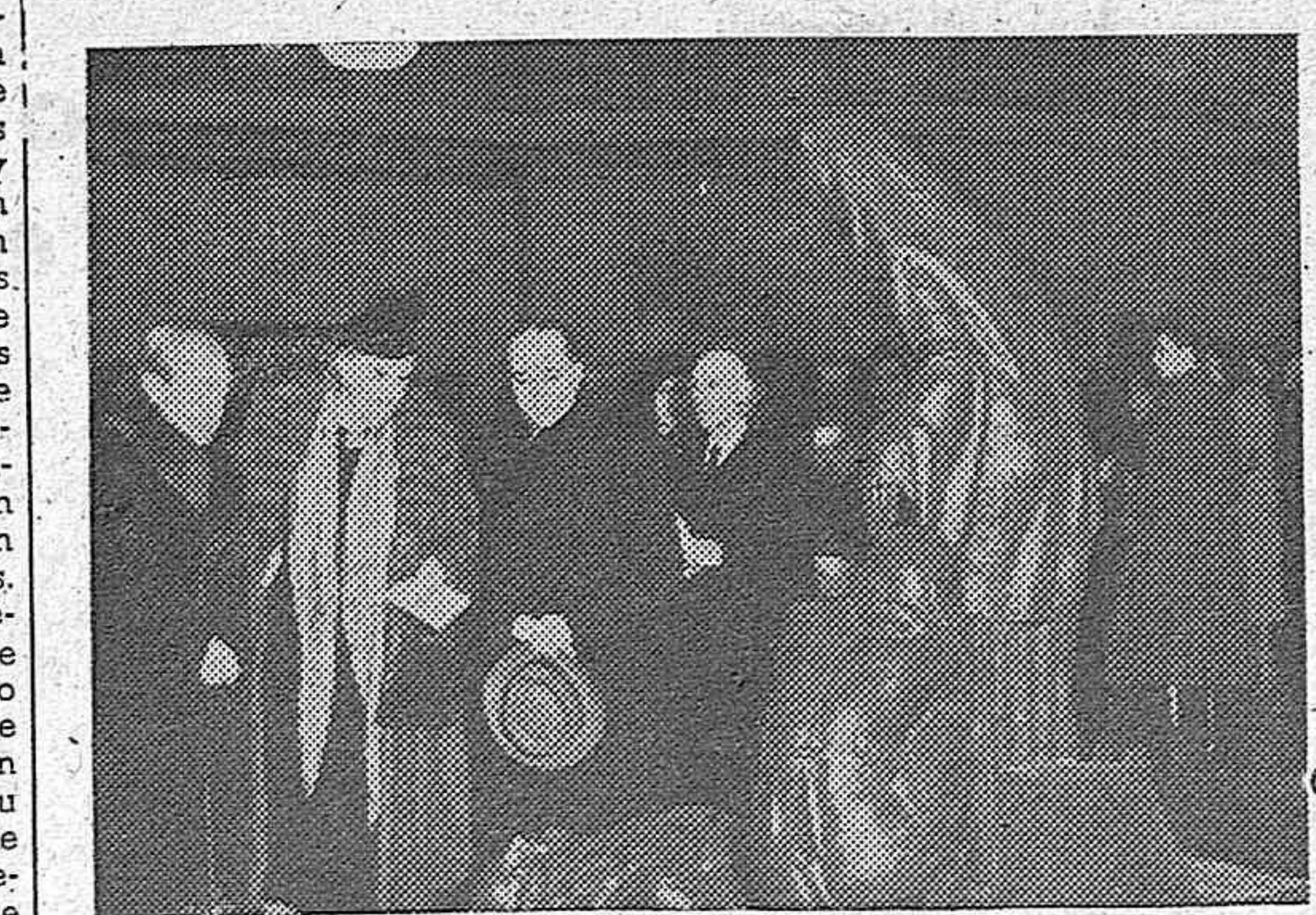
En el salón de Exposiciones del Círculo de Bellas Artes, convenientemente restaurado, se ha inaugurado la primera Exposición nacional de Pintura, Escultura y Grabado de la nueva España, organizada por la Asociación de Pintores y Escritores con el laudable propósito «de volver a los antiguos cauces de la escuela española, preterida por oportunistas sin escrúpulos y por incapaces manifiestos». El acto de la inauguración, al que asistió distinguida concurrencia, fué presidido por el ministro de Educación Nacional y el director general de Bellas Artes.