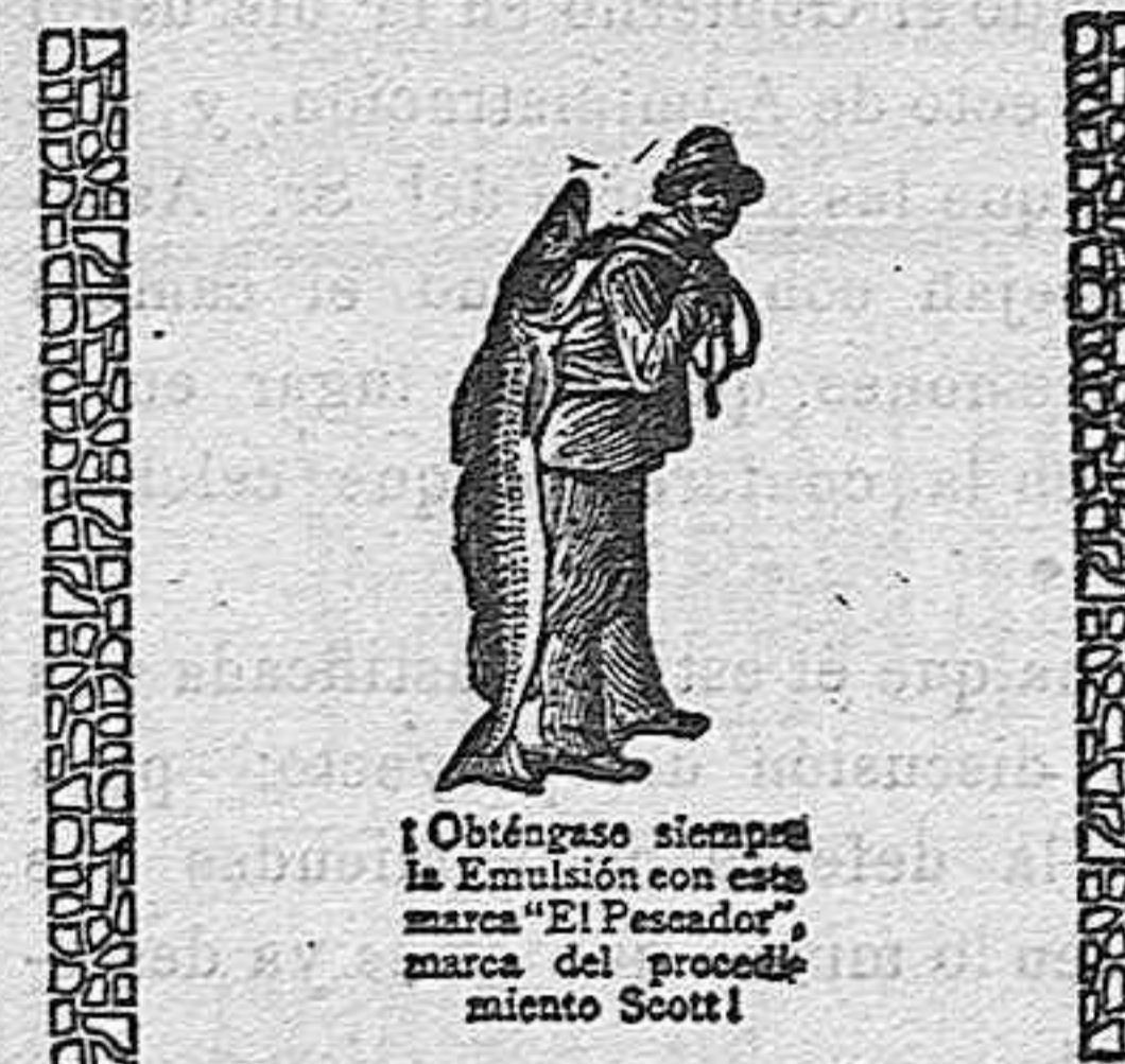
¡Obténase siempre la Emulsión con esta marca "El Pescador", marca del producto mismo Scott!

Los médicos ordenan la EMULSIÓN SCOTT porque saben de lo que está compuesta es decir de los productos mas puros y energicos del mundo.