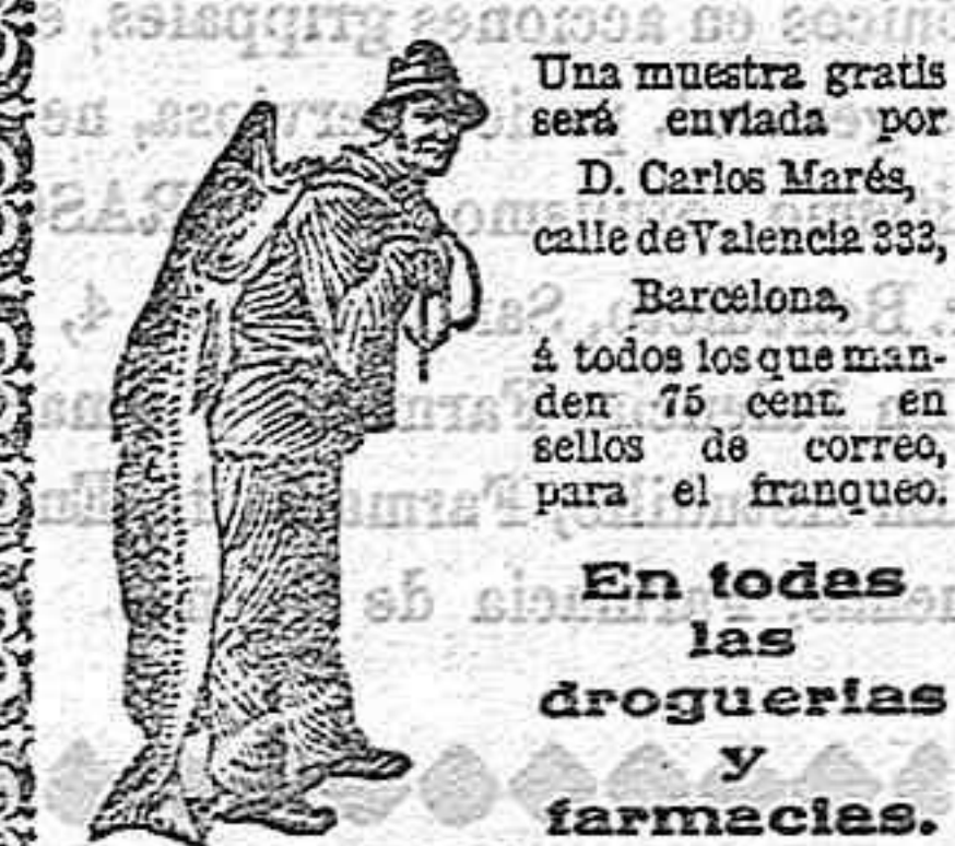
El Pescador y el Pescado