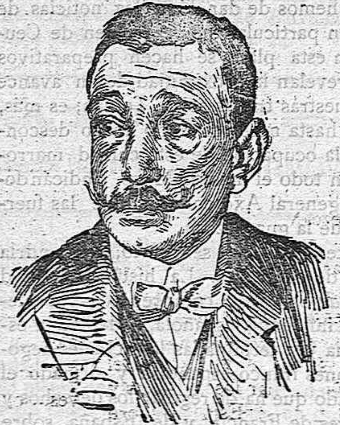
EL CONDE DE SAGASTA