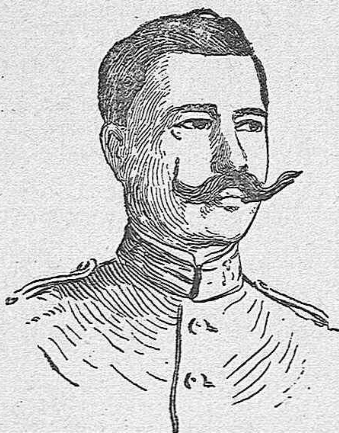
El teniente coronel Fernández Silvestre Jefe de la Policía española en Marruecos y comandante de las fuerzas de Alcázar y Larache.