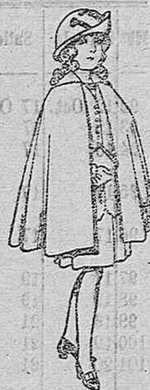
Capas de lana para niñas de 4 a 12 años. De ptas. 20 a 22