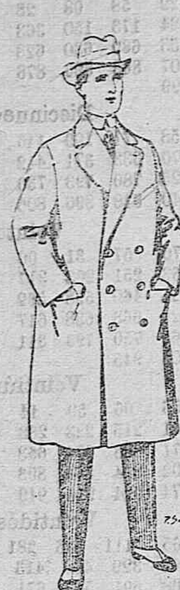
Gabanes de patén y de cheviot De ptas. 55 a 105