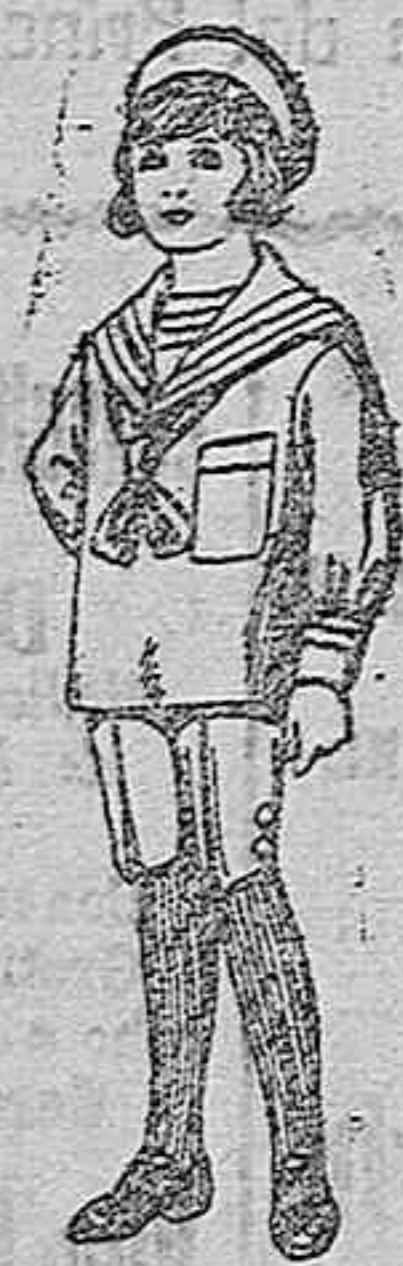
Traje de targa azul, bordado oro en la manga para niño de 4 a 9 años De ptas. 20 a 22.