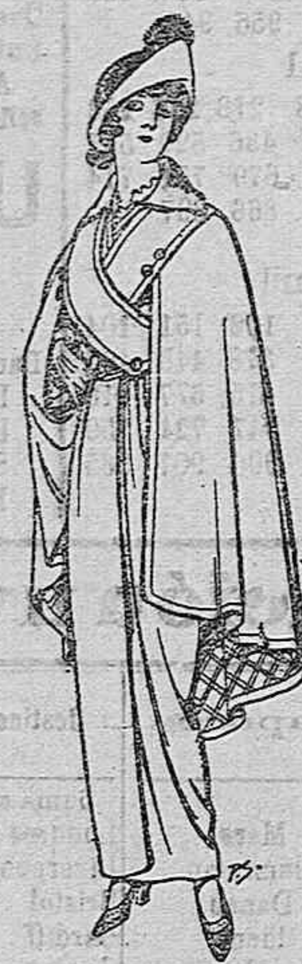
Capas de lana negra para señora. Ptas. 16