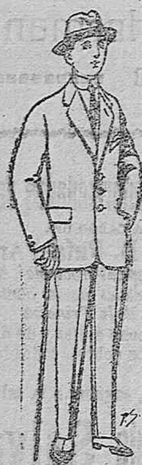
Trajes de patén vi- cuna o jerga para niños de 10 a 16 años. De ptas. 1 a