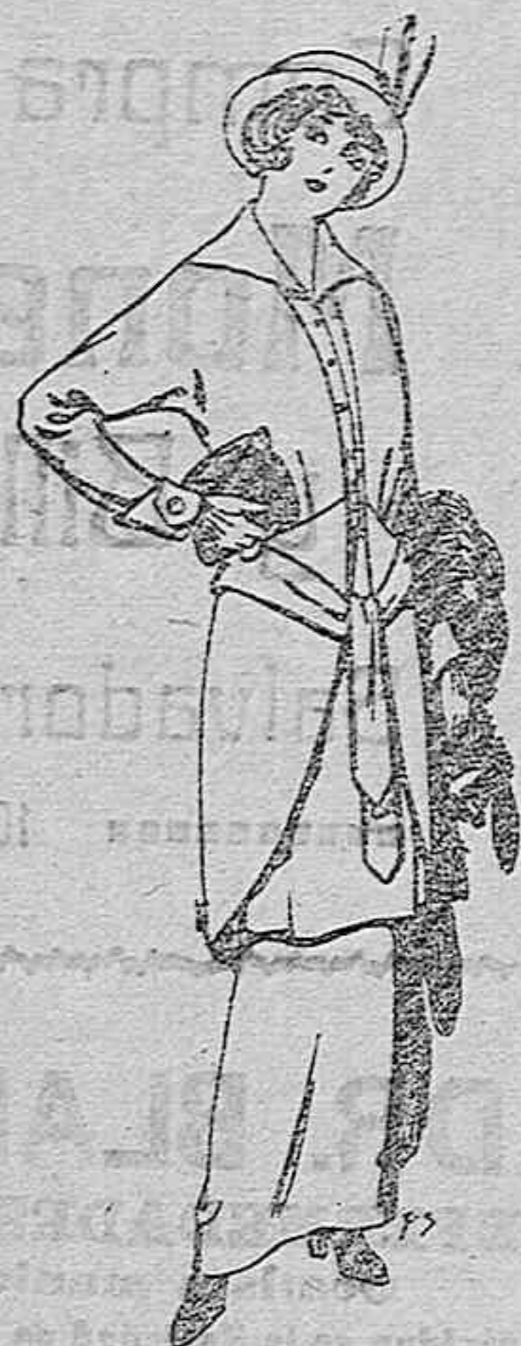
Traje de jerga negra y azul para señora Ptas. 85