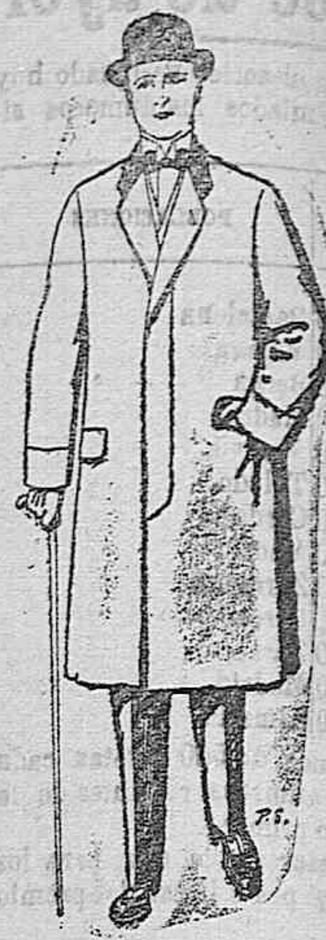
Gabanes de patén melton y cheviot De ptas. 25 a 100