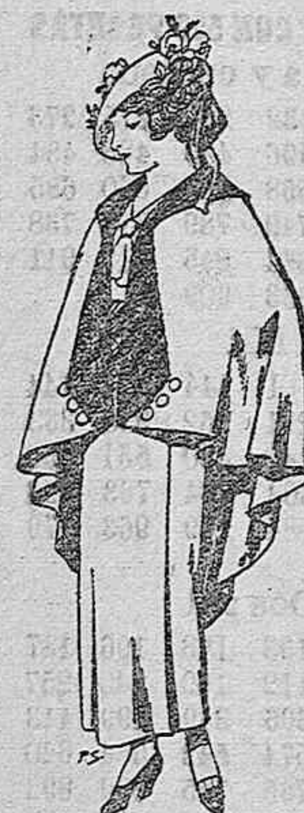
Capas de lana para jóvenes de 13 a 16 años De ptas. 25