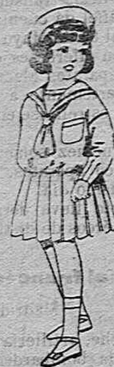
Trajes de marinera de lanilla azul para niñas de 4 a 9 años de pesetas 32 a 38 los mismos de dril blanco de 13 a 24 pesetas.