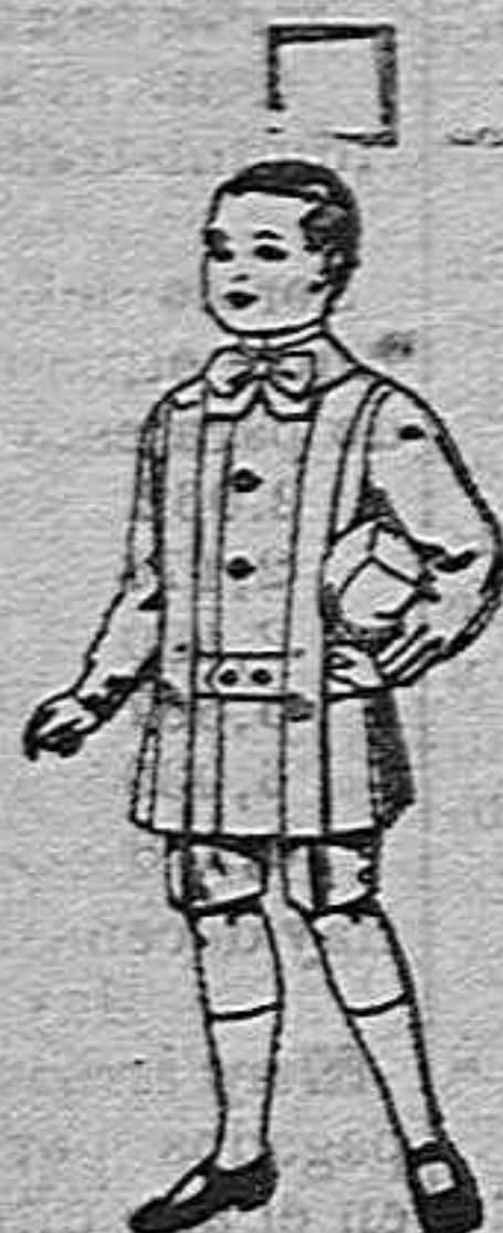
Trajes de lanilla para niños de 4 a 9 años. de ptas. 12 a 31