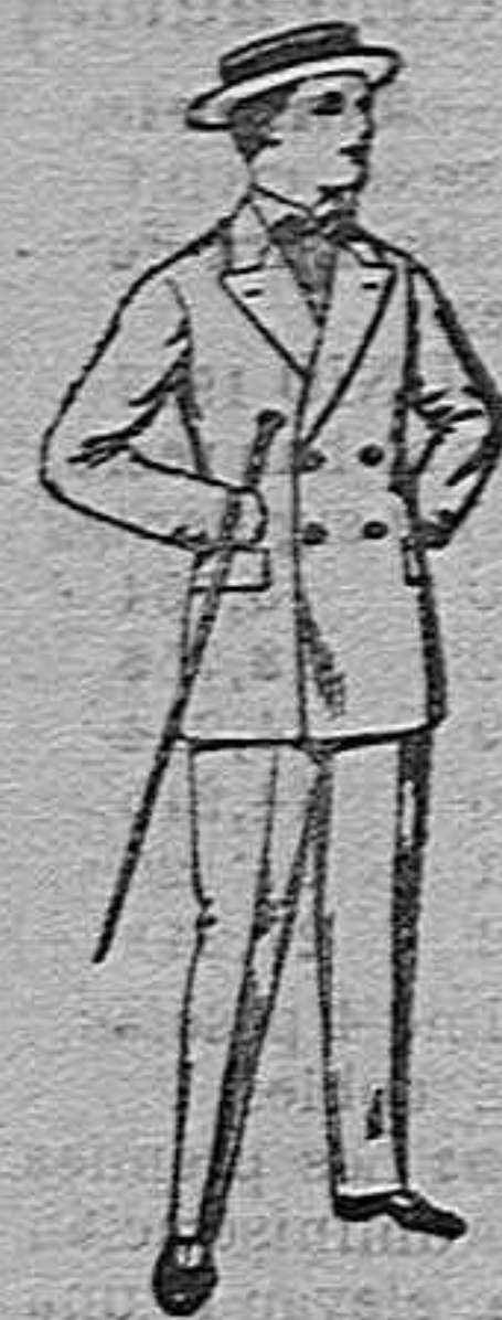
Traje de estambre, vicuña o jerga, para jovencito de 10 a 17 años. de ptas 19 50.