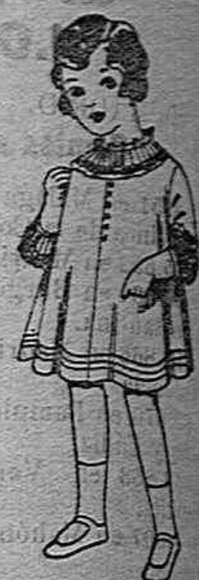
Vestidos de lana blanca o color. de ptas. 6 a 8

Géneros del país y extranjeros para la Sección de Medida. Sombreros de paja de 2'50 a 12 pesetas.