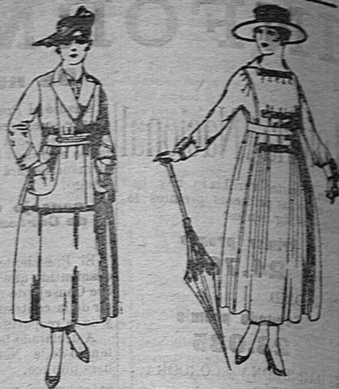
Traje de estambre negro, azul y color. de ptas. 70 a 70. Vestidos de lanilla negra, azul, colores de ptas. 60 a 70.