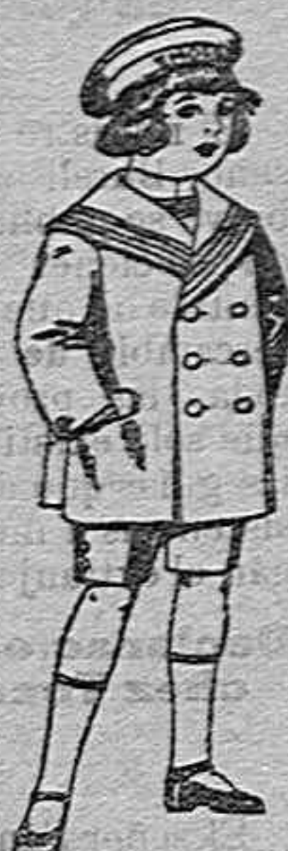
Trajes matelot de vicuña o jergal azul para niño de 4 a 9 años de 14 pesetas a 32.