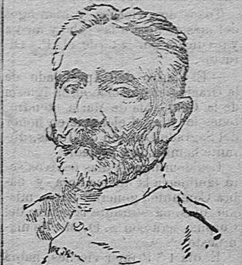
El General Alfau, relevado del mando de la Capitania general de Cataluña.