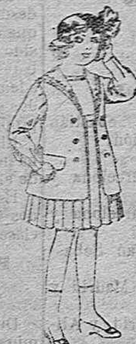
Traje de g-bardina blanco, cuello de orlandia bordado, para niñas de 4 a 9 años. de pesetas 22 r 24.