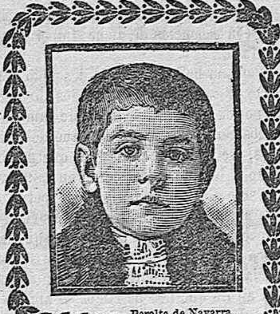
Peralita de Navarro, Enero 1908.

Y no hacemos bien. Es mejor prevenir, por mucho esfuerzo que todo ello nos cueste, que no tener que remediar.