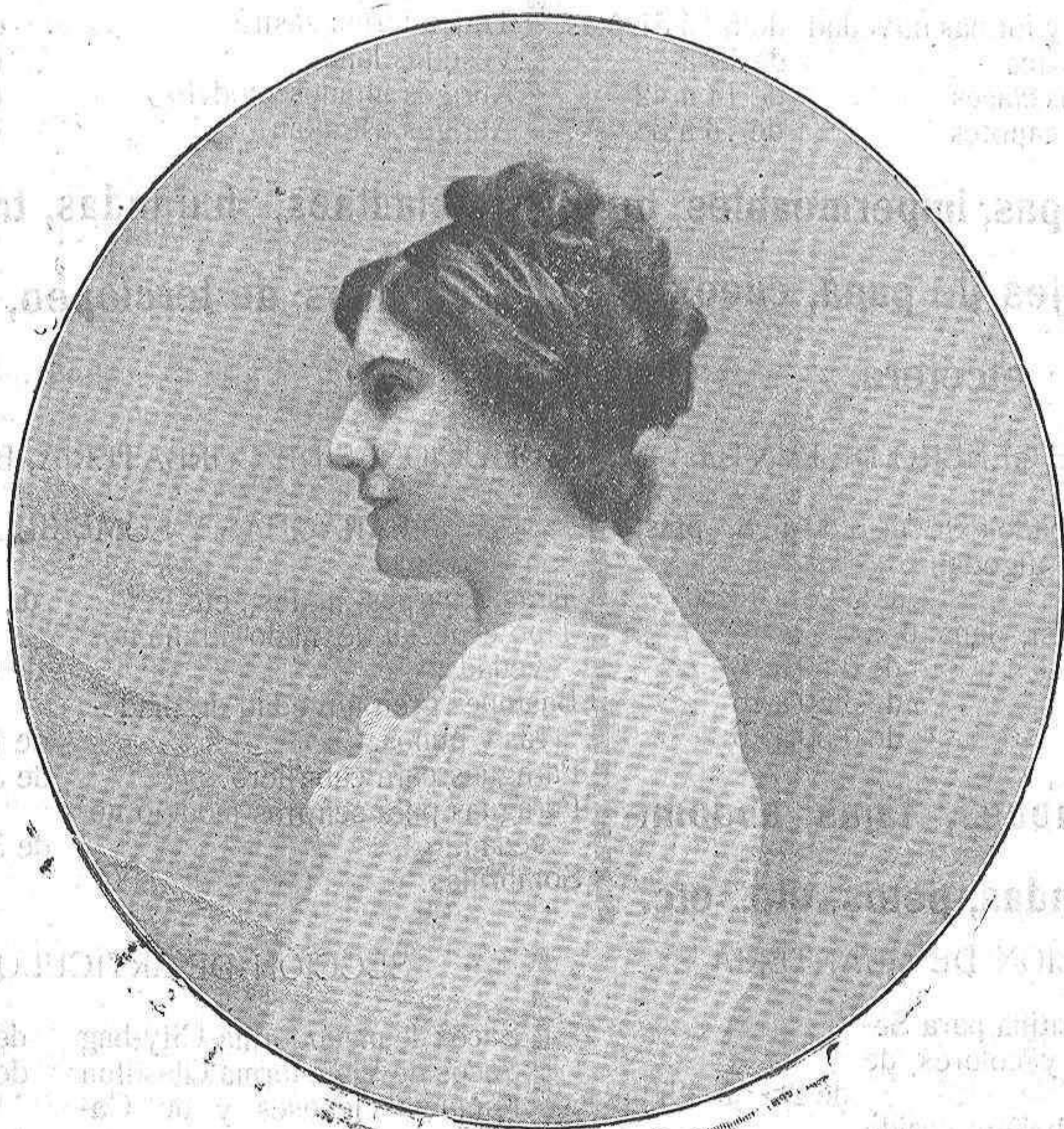
Primera tiple de la compañía que desde esta noche actuará en Variedades y que debutará con La Cocina y La República del Amor.

Las comidas, tiene usted erupciones, gases, pirosis, vahídos, pesadez de cabeza, ruidos en los oídos, sofocación, opresión, palpitaciones al corazón? Tome usted el Elixir Estomacal de Saiz de Carlos y se pondrá bien.