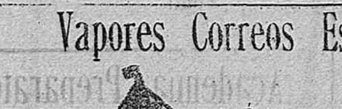
El nuevo vapor, provisto de telegrafía sin hilos y de todos los modernos adelantos.