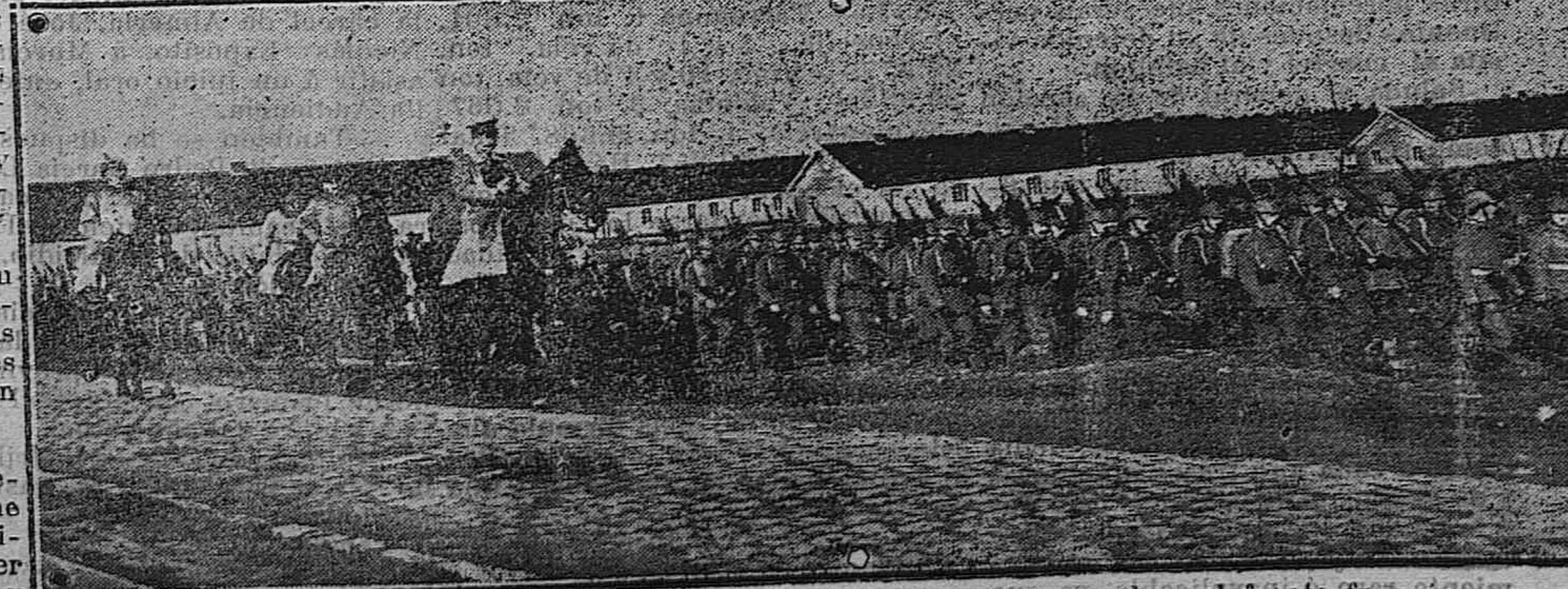
La Guerra Europea. — Revista de nuevas tropas que marchan al frente francés.

Después se dirigió al Teniente coronel de Carabineros, señor Cabo, á quien manifestó serle su cara conocida y creer recordar que