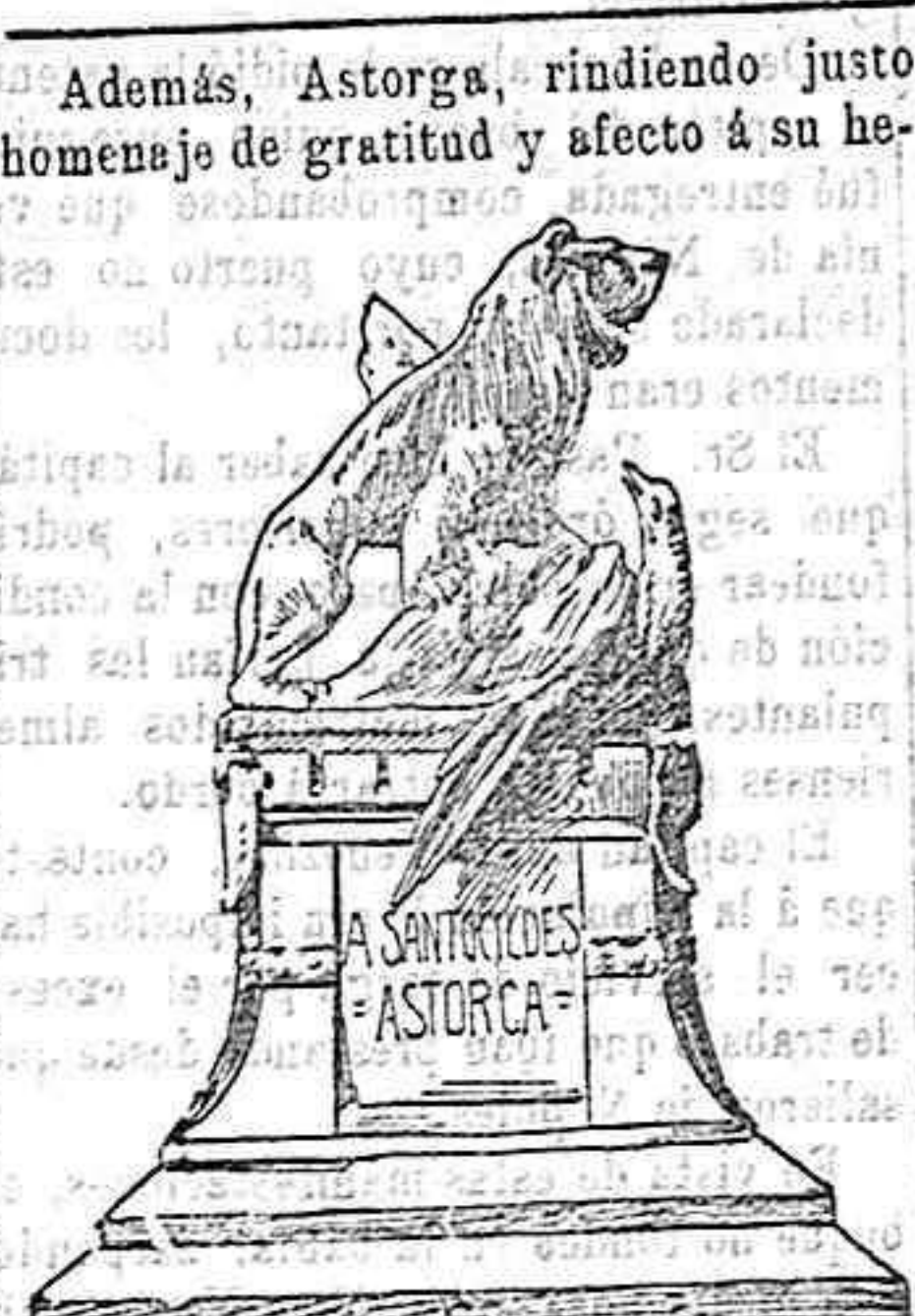
Monumento del Sitio de Astorga

Este vapor también admite carga para Brasil y la Argentina. Los señores viajeros deberán pedir las plazas y mandar los documentos con bastante anticipación. El despacho de billetes quedará cerrado el día anterior al de la salida del buque. Para más informes su Consignatario M. BERJON, Bulvar del Principe, 59.