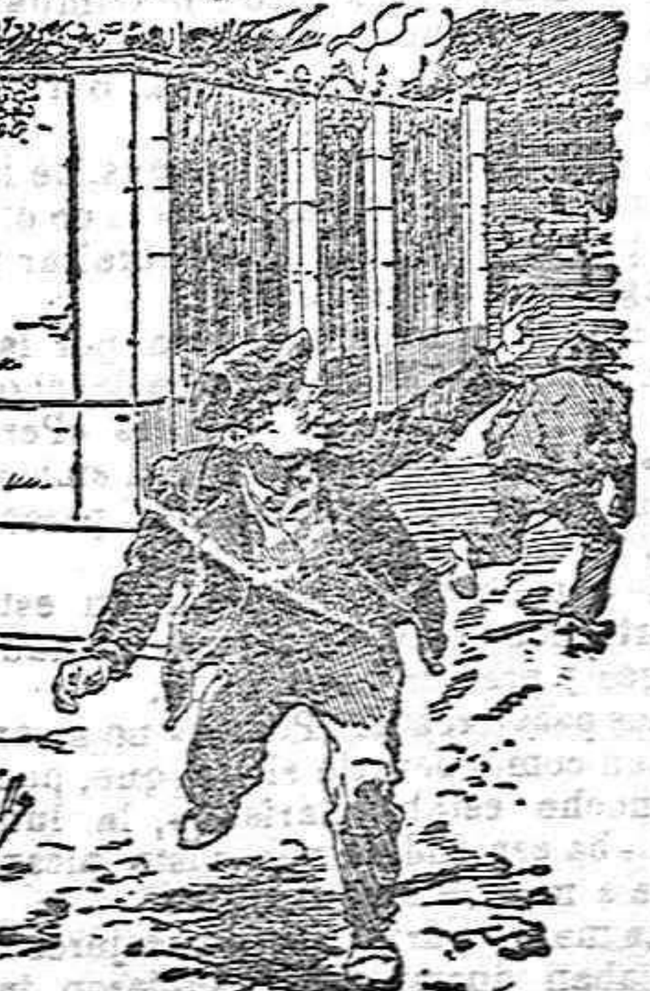
Las preciadas hojas de papel impreso.

Allá a la puerta de la redacción del periódico espera impaciente que se haga la tirada; que le cuenten «las manos» que ha pedido para venderlas y le falta tiempo al tener en su poder