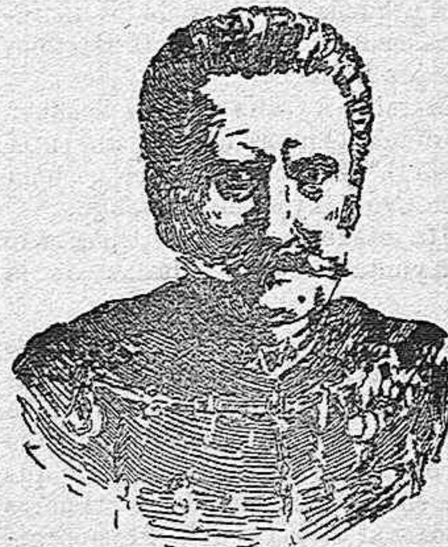
GENERAL BARÓN FEJERVARY

A juzgar por las noticias que se reciben de Viena y Budapest, el pleito entablado entre el anciano Emperador Francisco José y las oposiciones coaligadas del Parlamento húngaro, no lleva trazas de llegar á una solución amistosa, que establezca la buena armonía entre la corona y la mayor parte del pueblo magyar, poniendo término al incremento que de día en día va tomando el partido llamado de la independencia, con gran peligro de la paz y de la unión de Austria y Hungría.