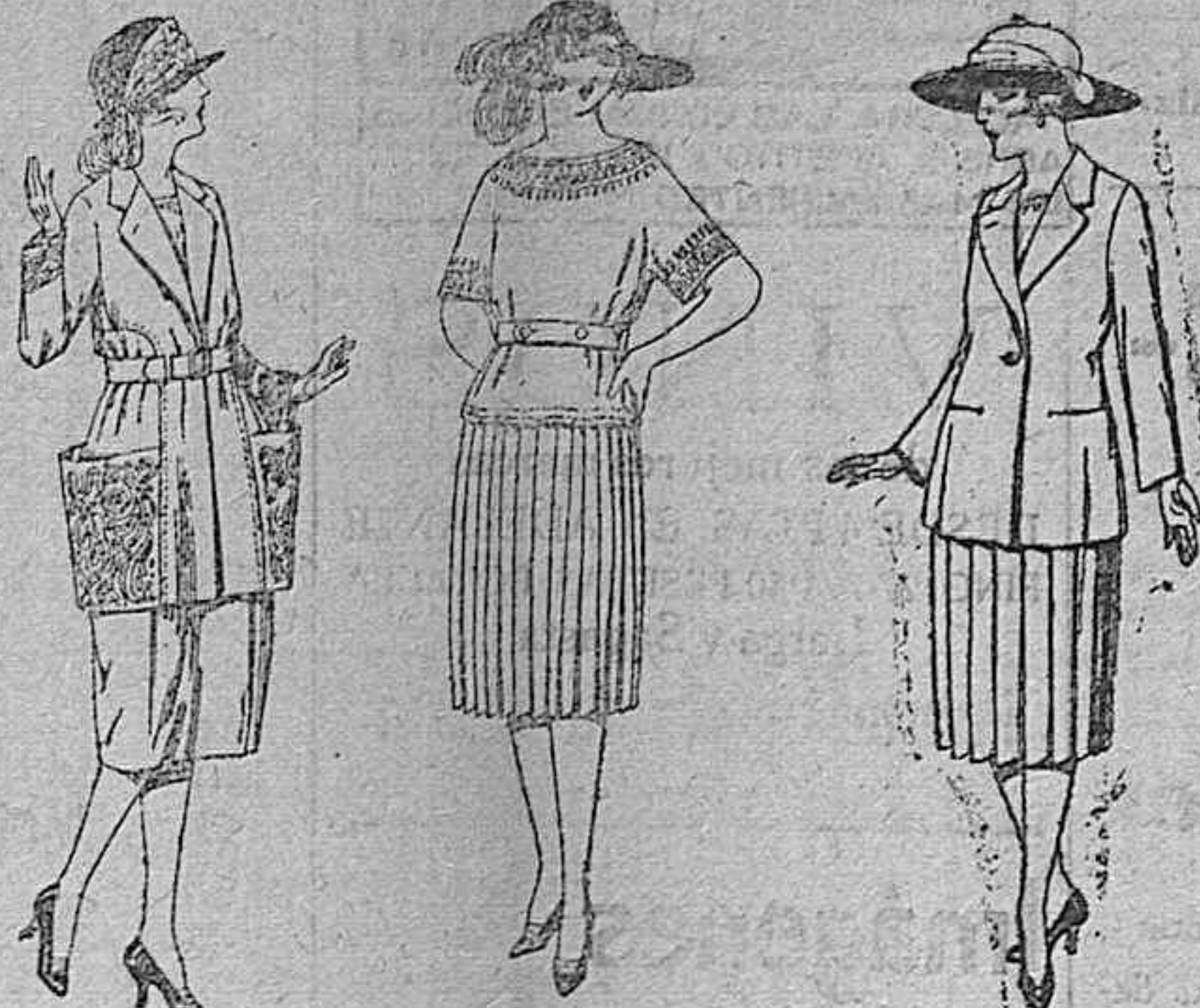
Trajes de habardina, lanilla, sarga inglesa, etc. en azul y color, adornos bordados. de ptas. 100 a 130