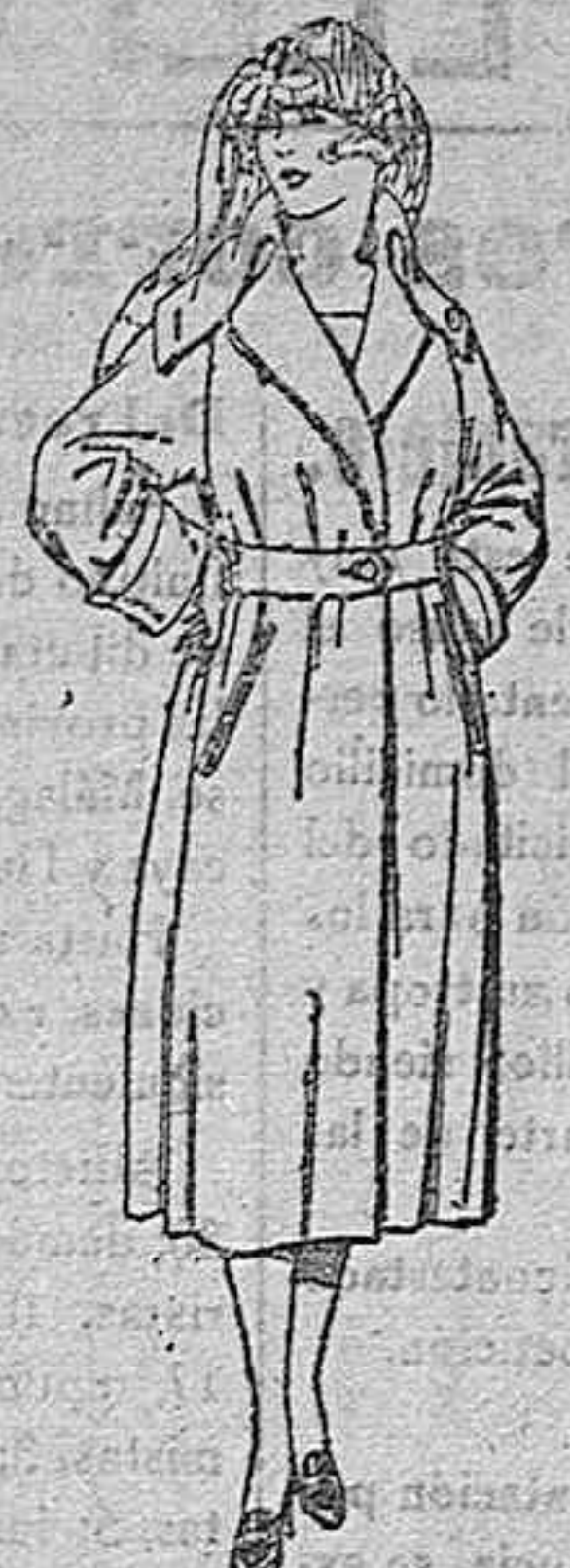
Abrigos de gabardina inglesa, impermeabilizada, en negro, azul y color. de ptas. 110 a 220