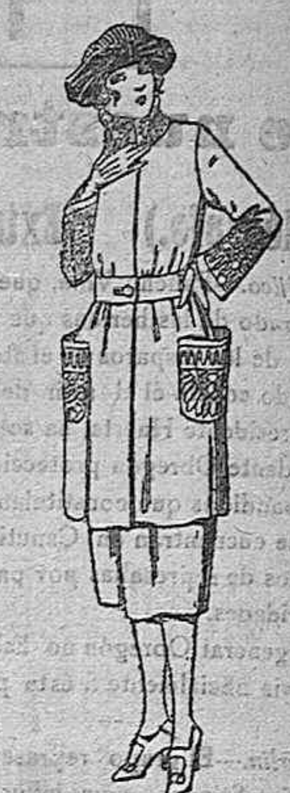
Trajes de sarga inglesa, estambre, lanilla, etc., en negro, azul y color, adornos bordados. de ptas. 145 a 180