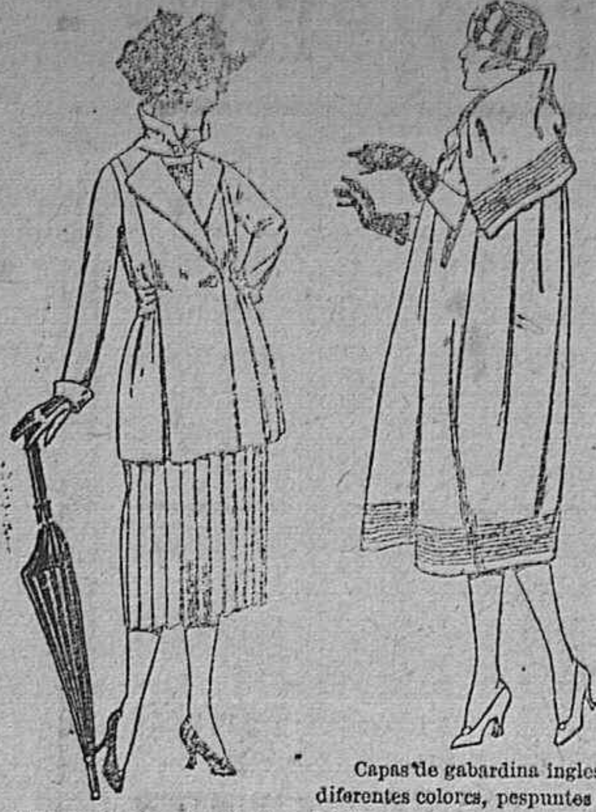
Trajes de gabardina, lanilla, estambre, etc., en negro, azul y color. de ptas. 130 a 163

SUCURSALES: Madrid, Barcelona, Alicante, Almería, Bilbao, Cádiz, Cartagena, Gijón, Granada, Málaga, Palma de Mallorca, Santander, Sevilla, Valencia, Valladolid, Zaragoza.