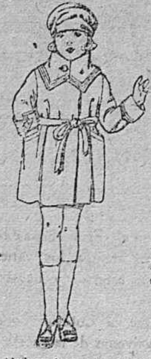
Abrigos de terciopelo, en azul y color, para niñas de 4 a 9 años. de ptas. 50 a 65