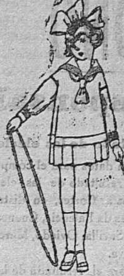
Trajes modelo. Marinera inglesa, de sarga, vicuña azul, para niñas de 4 a 9 años. de ptas. 45 a 70