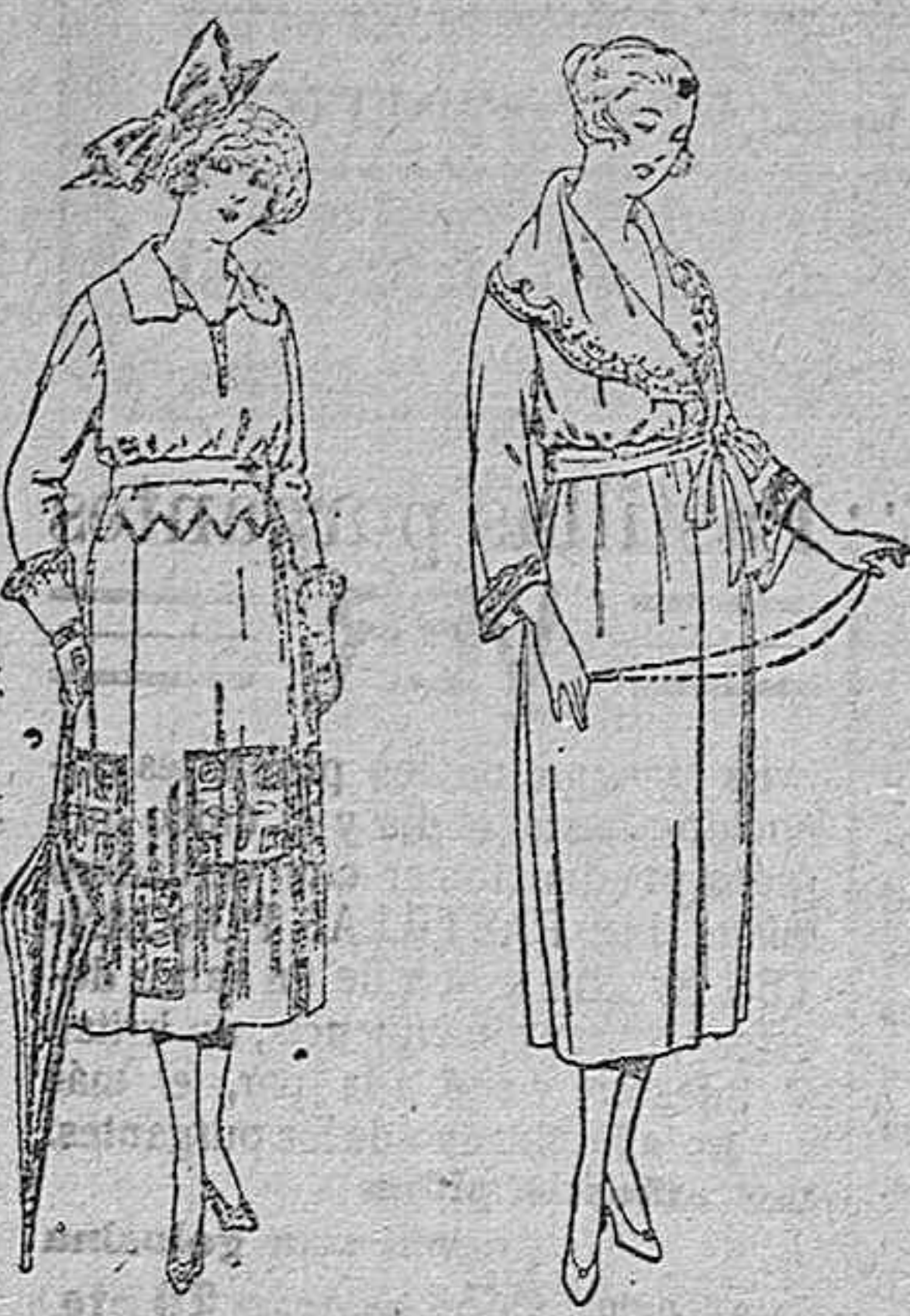
Vestidos de sarga inglesa, lanilla, estambre, etc., en negro, azul y color, adornos bordados. de ptas. 115 a 150