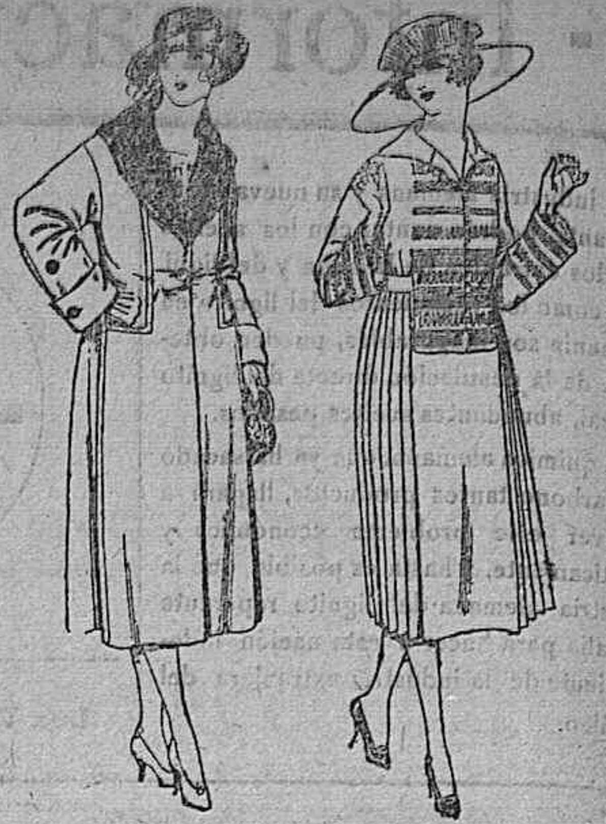
Abrigos de gamuza, pañete, en negro, azul y color, adornos terciopelo negro. de ptas. 120 a 150