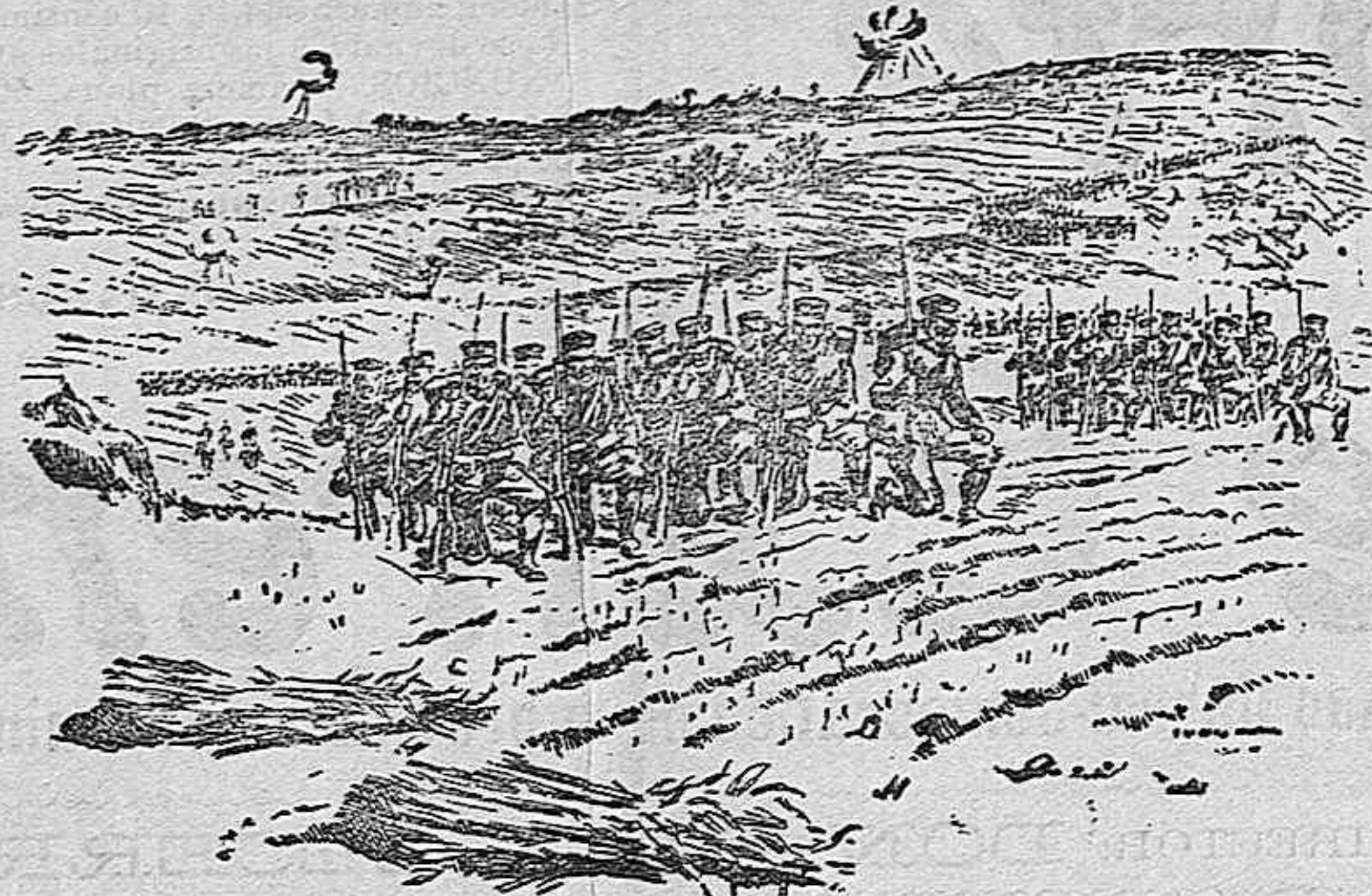
Infantería japonesa preparándose á rechazar á los rusos en su ataque á Litau-Jentau

Por fin hoy, se mandaron á Cáceres para esta atención 6.000 pesetas, que no me ha costado pocos viajes al Ministerio.