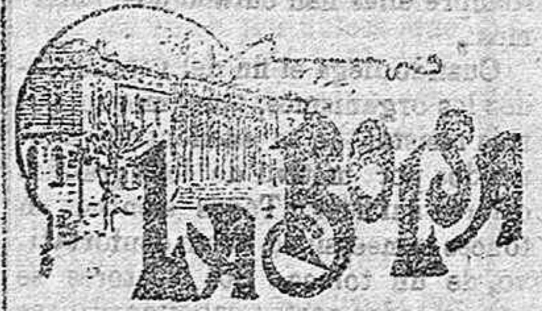
OSTIZACIÓN DEL DÍA 1.