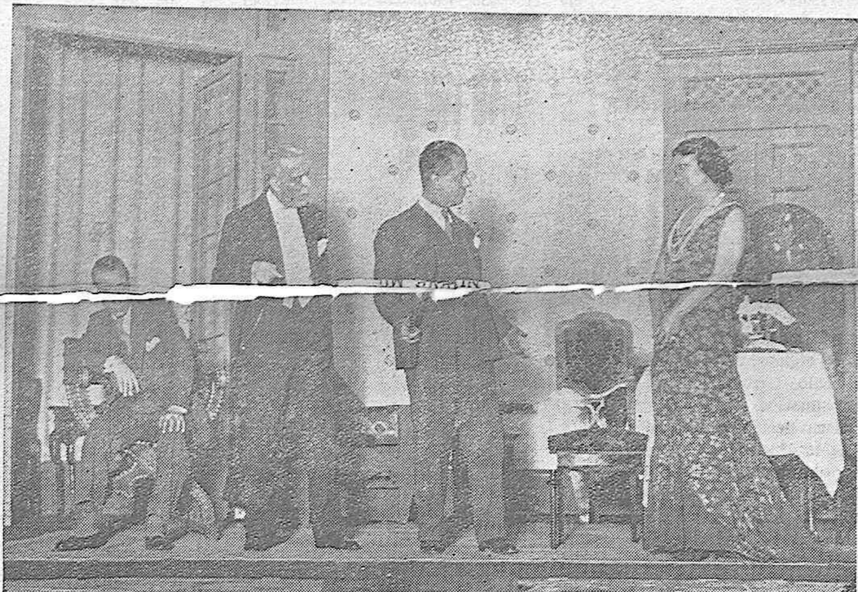
Una interesante escena de la farsa en tres actos, «Tolín, Tolón».

DEL ESTRENO DE «TOLÍN, TOLON» EN EL TEATRO DE LA ZARZUELA, DE MADRID