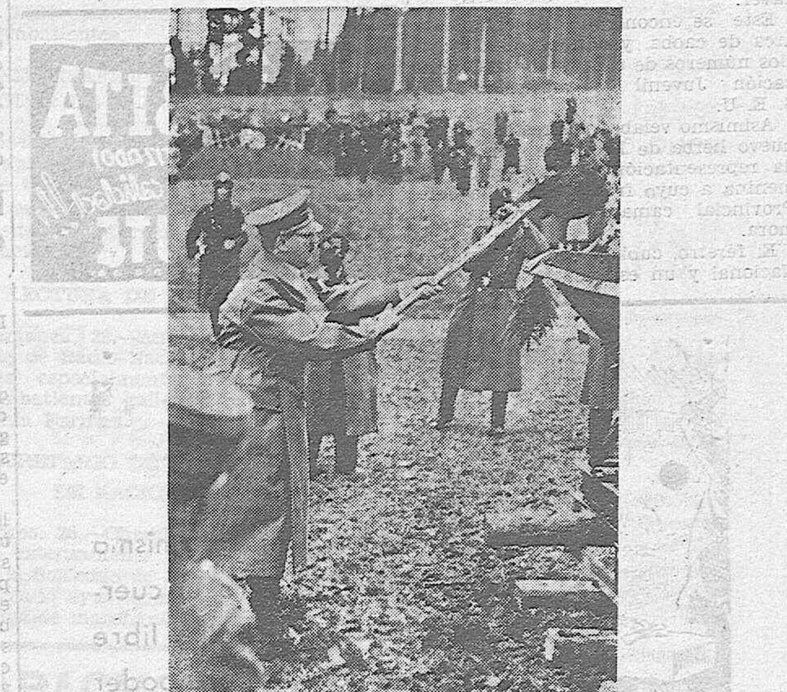
El Canciller Hitler en Walsberg, cerca de Salzburg (Monte de Wals), dá con una azada, la señal, para el comienzo de la construcción de la autoestrada Salzburg-Viena

A raíz de la organización de la juventud, confiada por la ley de 1.º de Diciembre de 1935 a la entidad denominada Juventud Hitleriana, se inició un programa para dotar a la organización de los edificios necesarios para el cumplimiento de sus fines. Este programa de construcciones era ambicioso, porque ya no se querían aprovechar para alojamientos, como sucedió al principio, cuarteles de bomberos y antiguas posadas, más o menos destaraladas, que solo podían servir para ejercicios pasajeros. La verdad es que la Juventud Hitleriana tiene cometidos que no pueden compararse con los de otras organizaciones anteriores. No se trata ya de dar a la juventud alojamiento en lugares de paisaje encantador, facilitando el descanso de los trabajos de la ciudad. Ahora se persiguen fines educativos y culturales que requieren la existencia de un ambiente con ellos relacionado. Cada Hogar ha de disponer de un campo de deportes y, en la medida de lo posible, de una piscina. El Hogar ha de ser un punto de reunión constante y ha de irradiar activamente los principios morales y físicos que se quieren llevar a cabo en beneficio del porvenir de la nación. Claro es que el programa de construcciones no puede realizarse en breve tiempo. Pero, sea como fuere, el año pasado se construyeron 543 Hogares y ahora están en curso de edificación otros 1400.