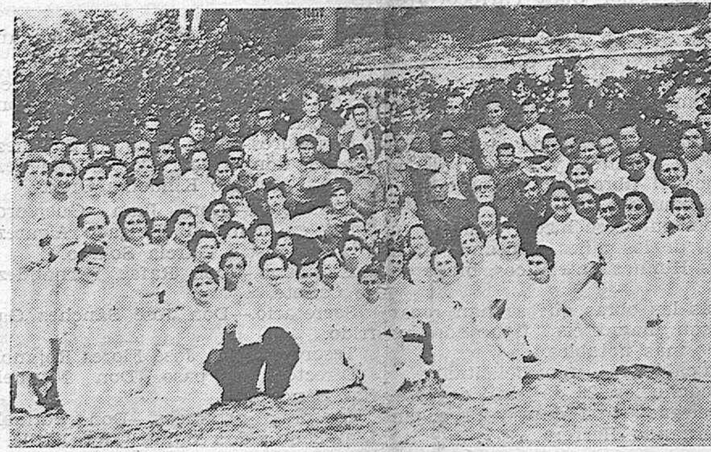
Festival del Duque de Rivas.-Las autoridades, los heridos, los artistas del festival y nuestras camaradas de Falange (Asistencia a Frentes y Hospitales) en un descanso del espectáculo

Estas son las razones que aconsejan la lectura de excelentes libros desde la niñez, desde que se inicia la conciencia del hombre, y para que la selección de libros fuera eficaz y depurada, debería someterse a censura ponderada y ecuaníme, sin caer en ridículas gazmoñerías ni en excesivas libertades.