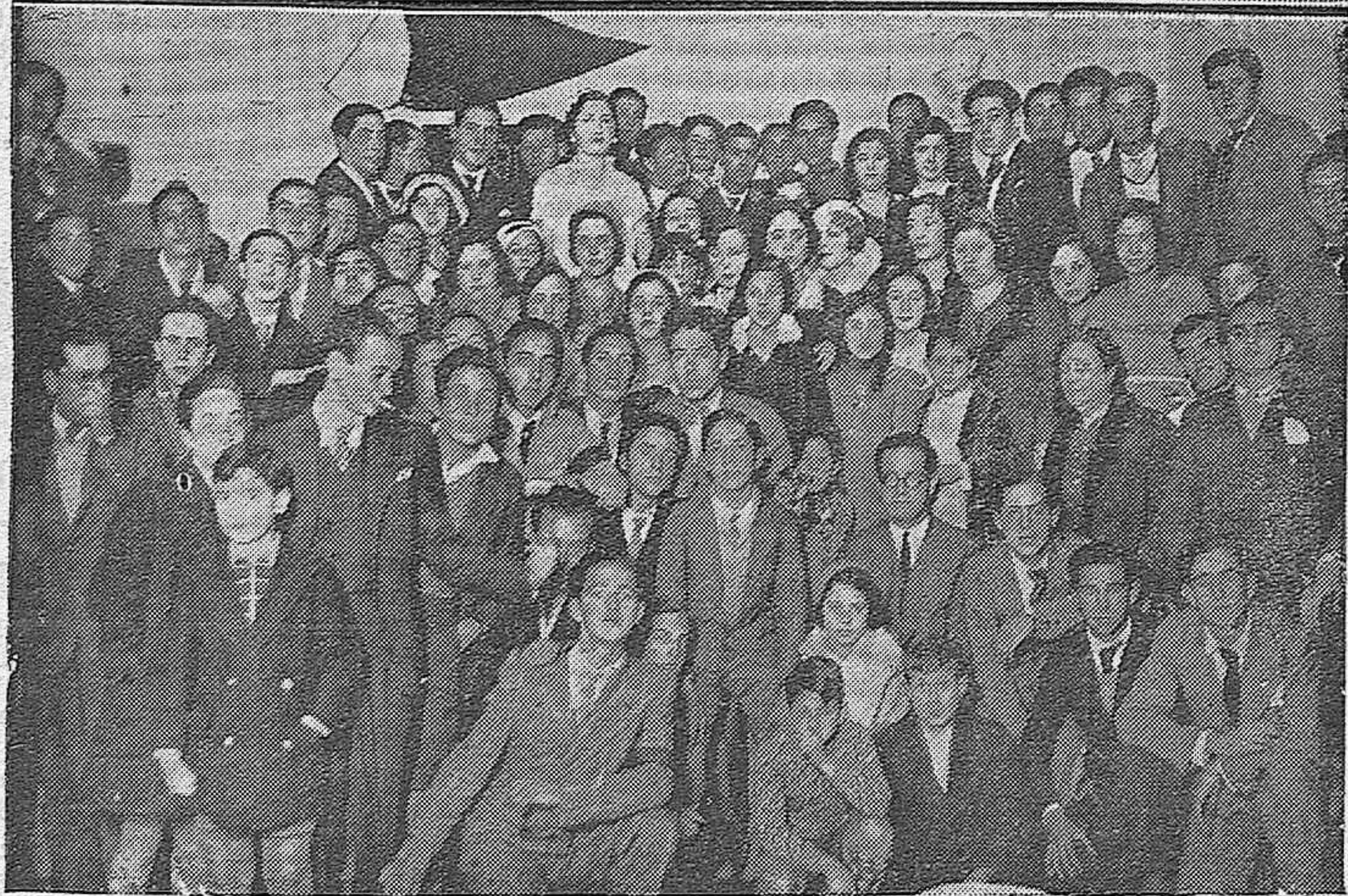
NOTAS GRAFICAS DE CORDOBA. —Señoras y señoritas pertenecientes al Club Cultural "Arenas" de Sevilla que han visitado nuestra capital.—Baile con que obsequiaron a la familia de los socios los estudiantes cordobeses pertenecientes a la F. U. E.