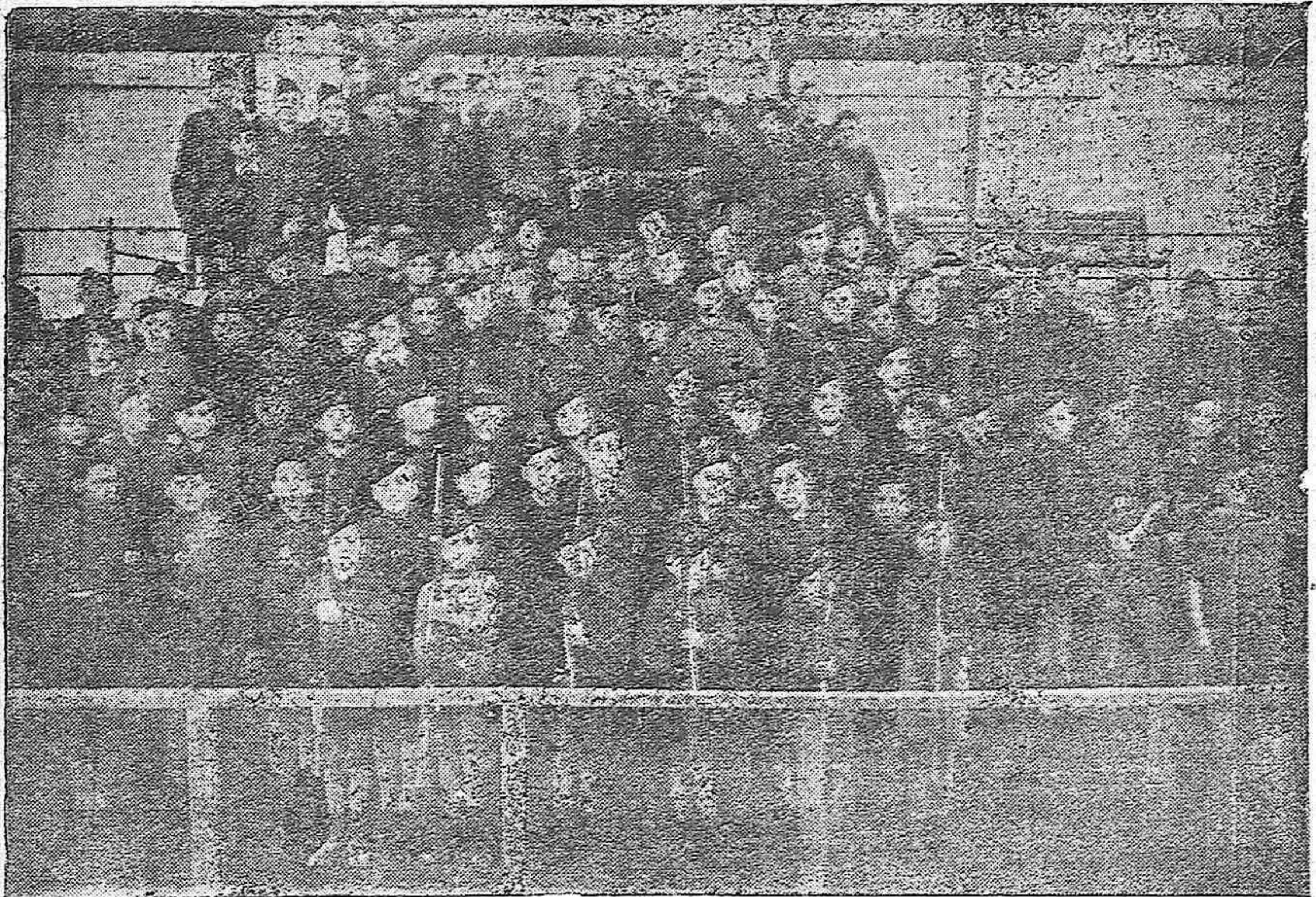
Nuestros flechas en su campo de instrucción del Stadium