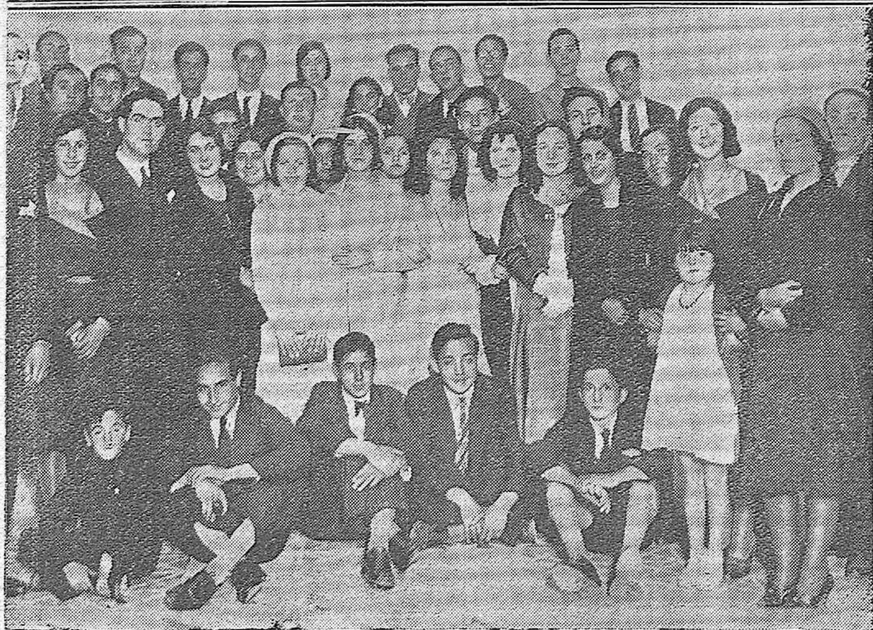
LAS FIESTAS DE LA F. U. E. —Grupo de oradores que intervinieron en el acto cultural celebrado anoche en el Instituto de Segunda Enseñanza. Una nutrida representación de estudiantes de ambos sexos de la F. U. E. que tuvo destacada representación en los actos de ayer