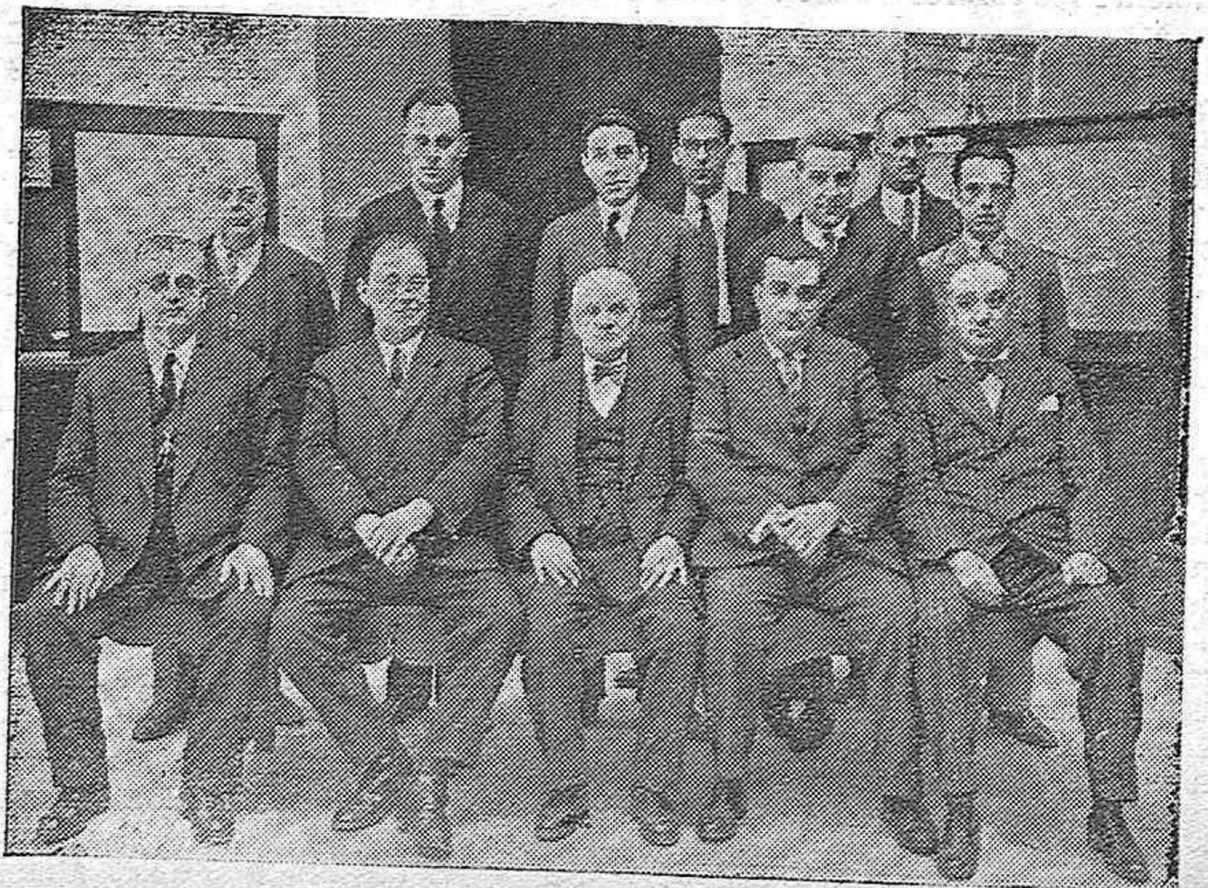
Los empleados del Monte de Piedad y Caja de Ahorros afectos a la Casa Central, en la calle Ambrosio de Morales.

Y nada más. Agradecidos a las atenciones de que, en nuestra misión informativa, fuimos objeto y a esperar el momento en que el próximo desempeño de lotes pueda hacer explosión en la gratitud de tantas familias humildes.