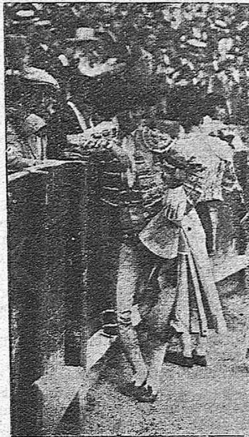
Una de las últimas fotos de Joselito, en la plaza de Madrid, pocos días antes de la tragedia

"Guerrita" habla de la muerte de Joselito Cuando Guerrita supo la noticia fué presa de gran agitación e impresionado fuerte-