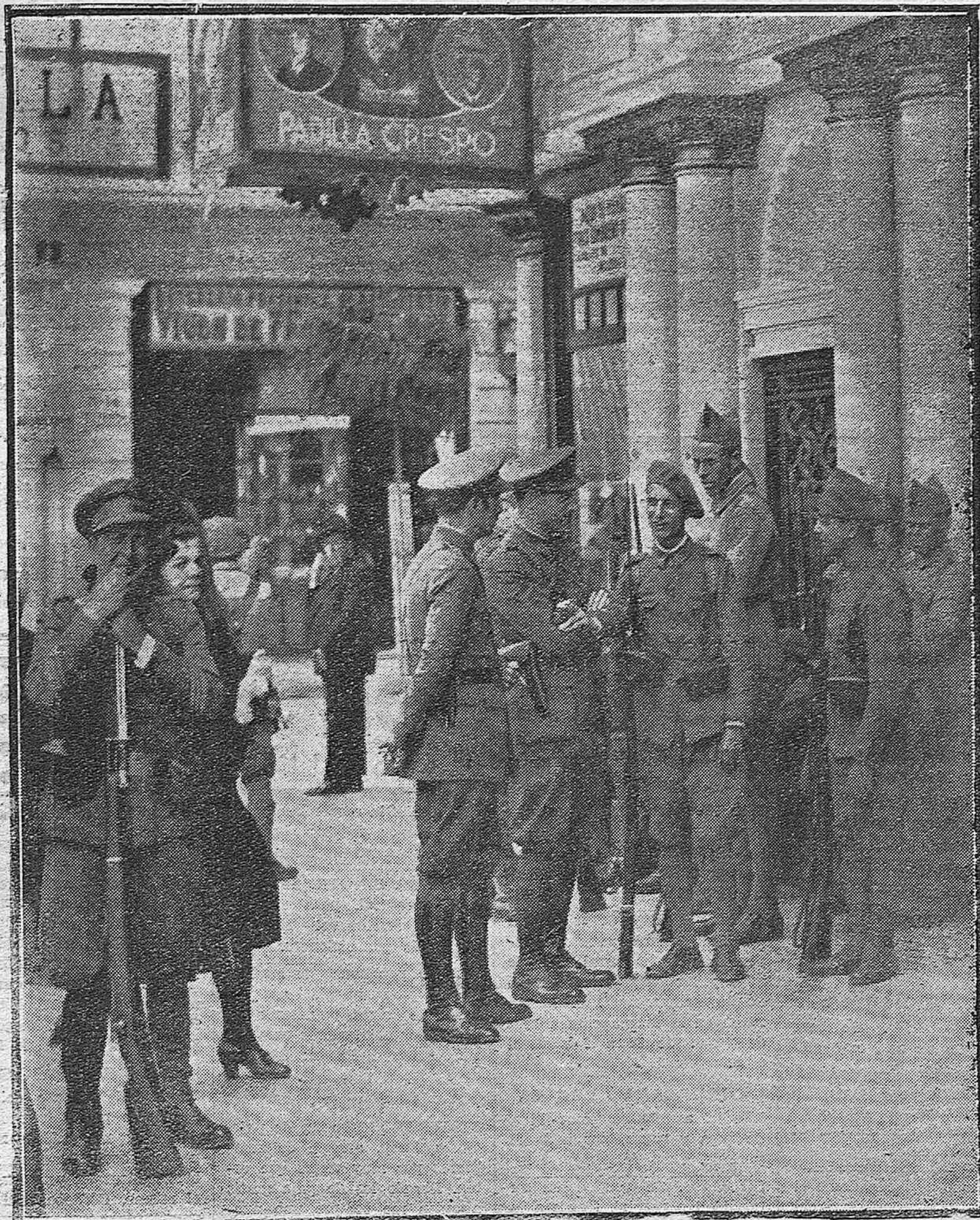
HACIA LA NORMALIDAD. —La foto revela el estado tranquilo de la ciudad; este grupo de oficiales y soldados en la vía pública es la única demostración de que nos hallamos en estado de guerra.