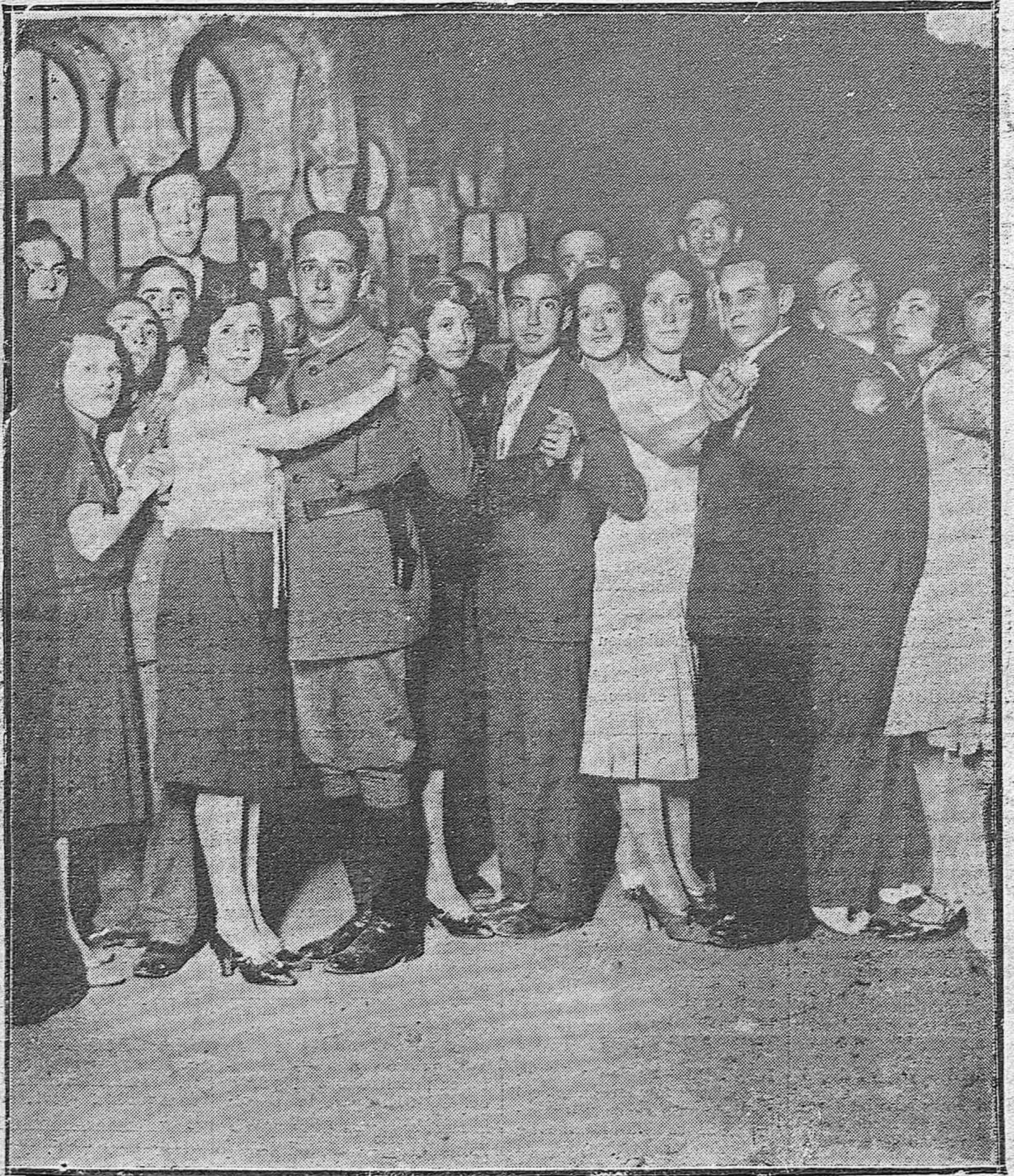
EN LA UNION MERCANTIL RECREATIVA. — SIMPÁTICA FIESTA CELEBRADA CON MOTIVO DEL ANIVERSARIO DE SU FUNDACIÓN.