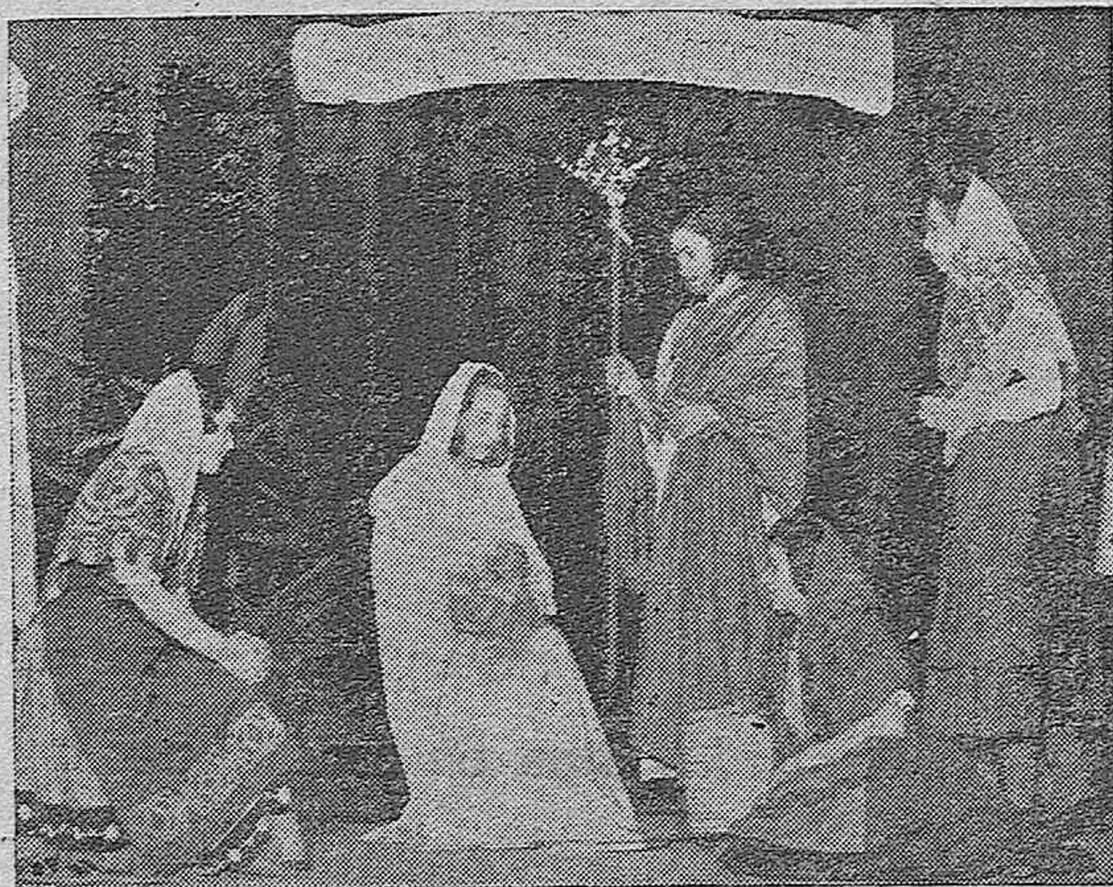
Entre los actos organizados por la Juventud Femenina de Acción Católica con motivo de la campaña de Navidad, se ha celebrado la representación del Misterio de Navidad, por muchachas de la Juventud