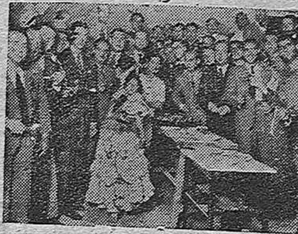
Fiesta en la caseta campera «La Corozas»

Ello ha hecho que el Ayuntamiento haya pensado ya, para el año próximo, en instalar el real de la feria, con la amplitud que requiere su importancia.