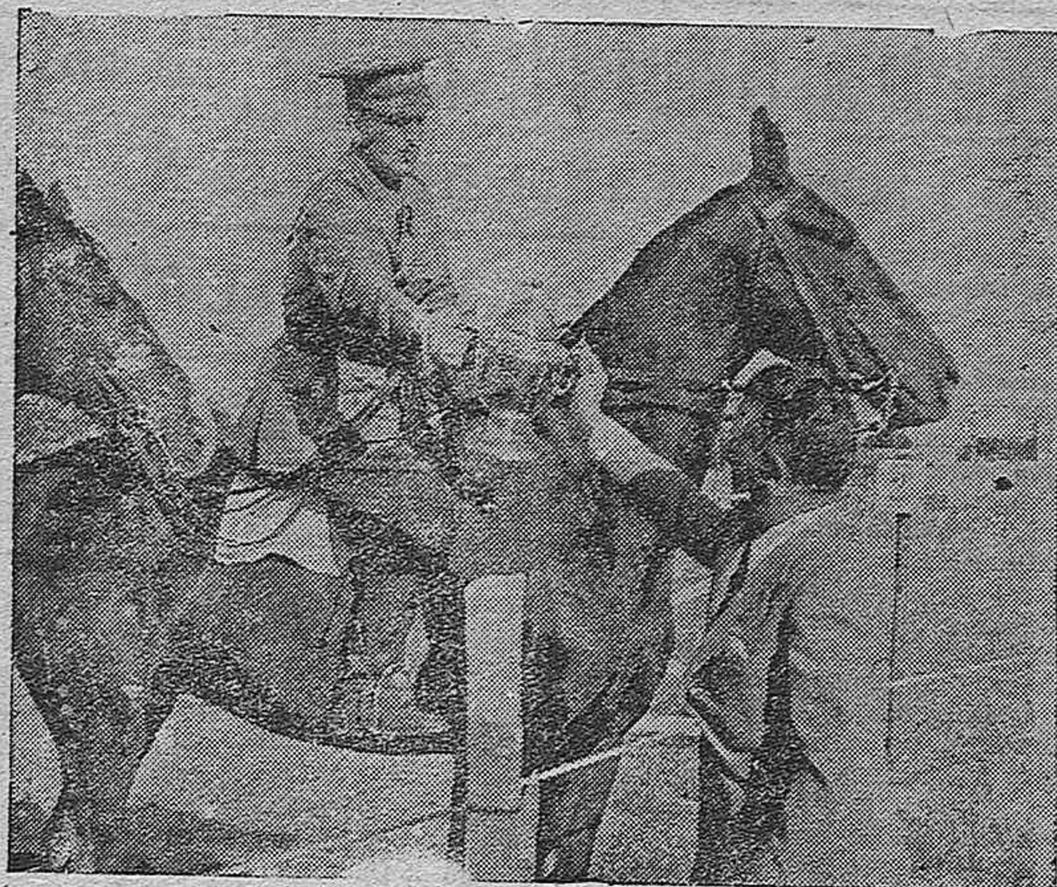
El Alcalde de Córdoba, hace entrega de una copa, a un oficial del Ejército, premiado en el Concurso Hípico Nacional

Hoy, la "Prueba de Amazonas" con importantes premios