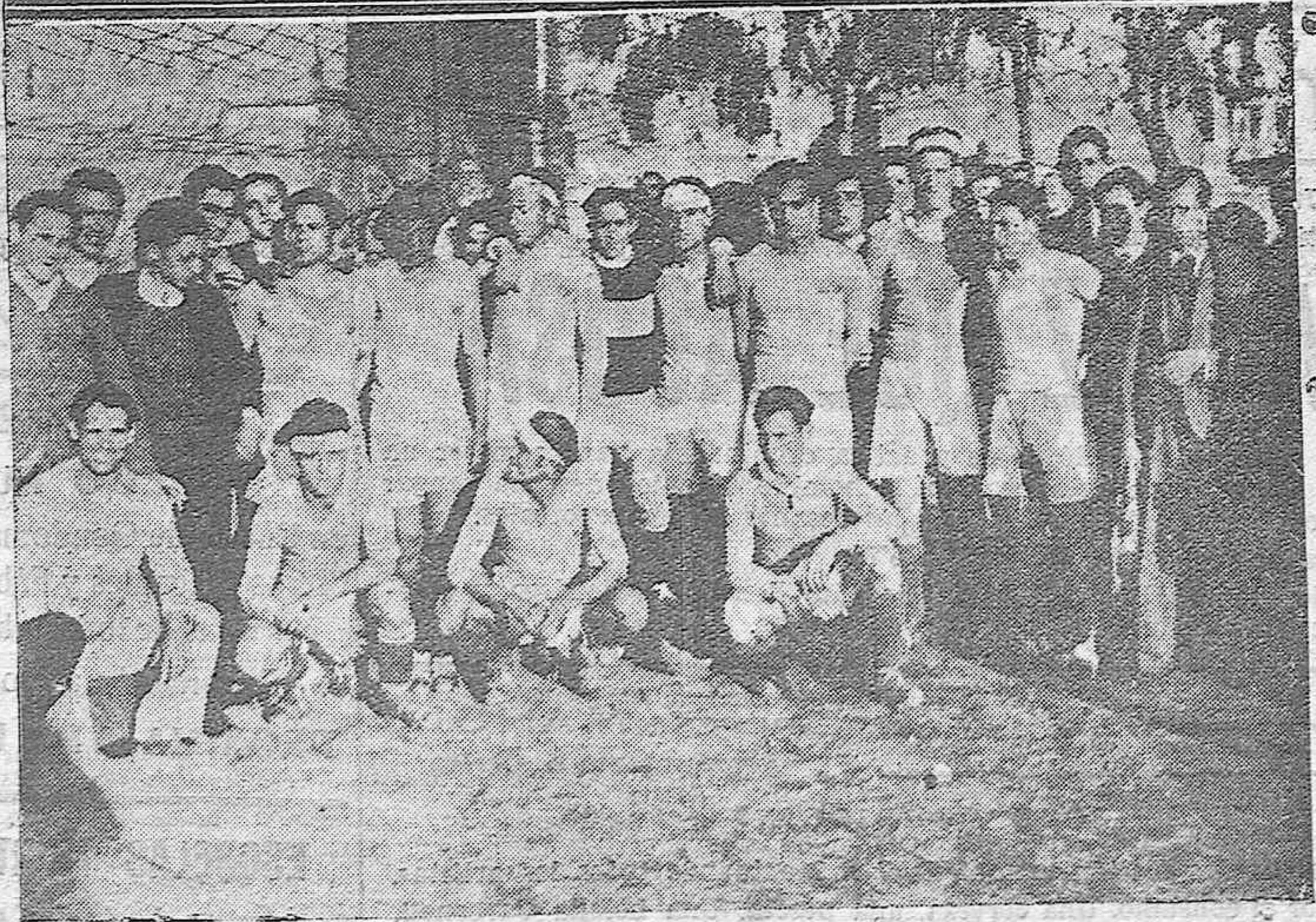
Varios equipos locales que tomaron parte en los diversos partidos de futbol, celebrados en el Stadium Amé- rica, el domingo 8 de Marzo