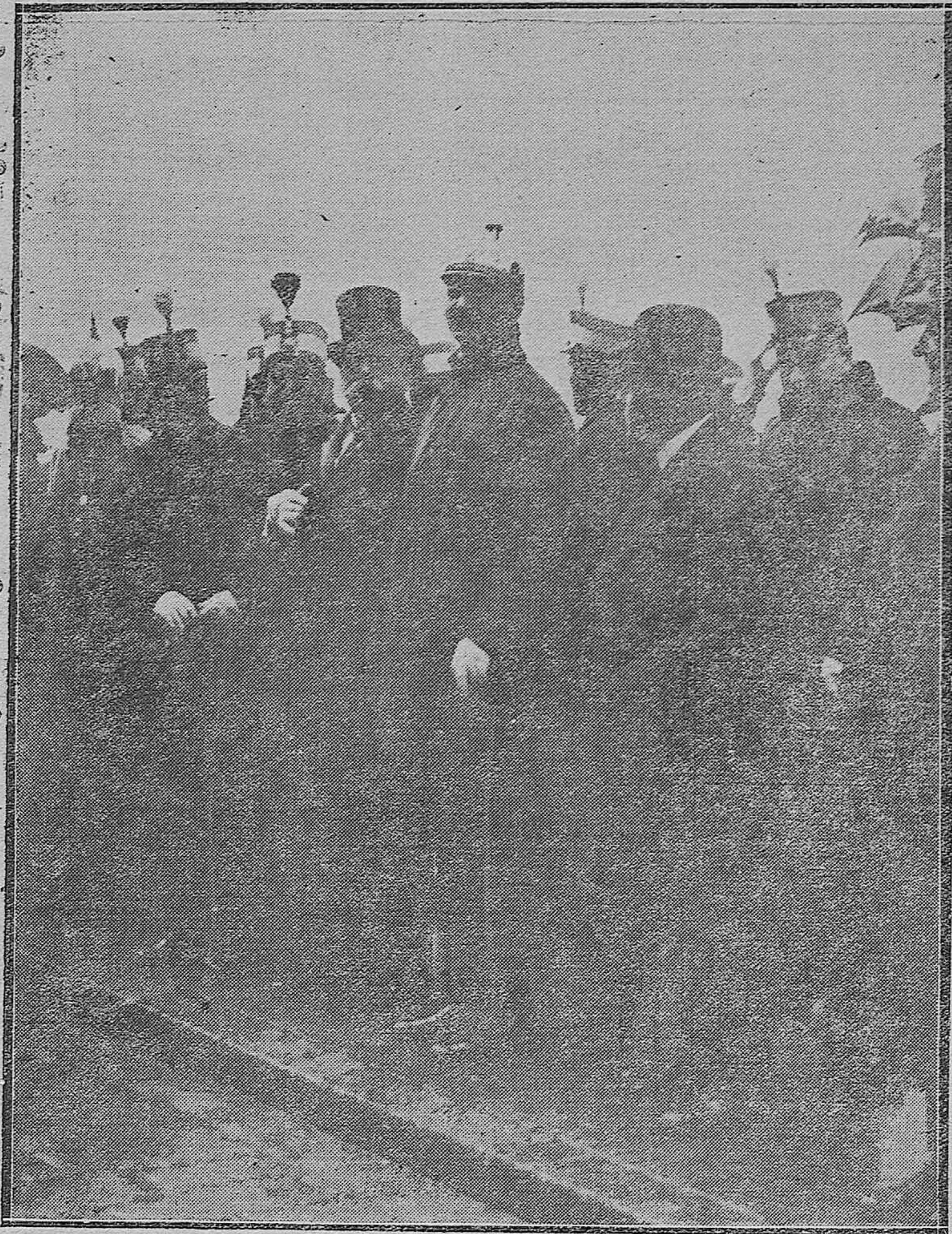
LA PATRONA DE LA INFANTERIA.—El gobernador militar con las demás autoridades, presenciando el desfile de la fuerza que asistió a la Misa en la Compañía.