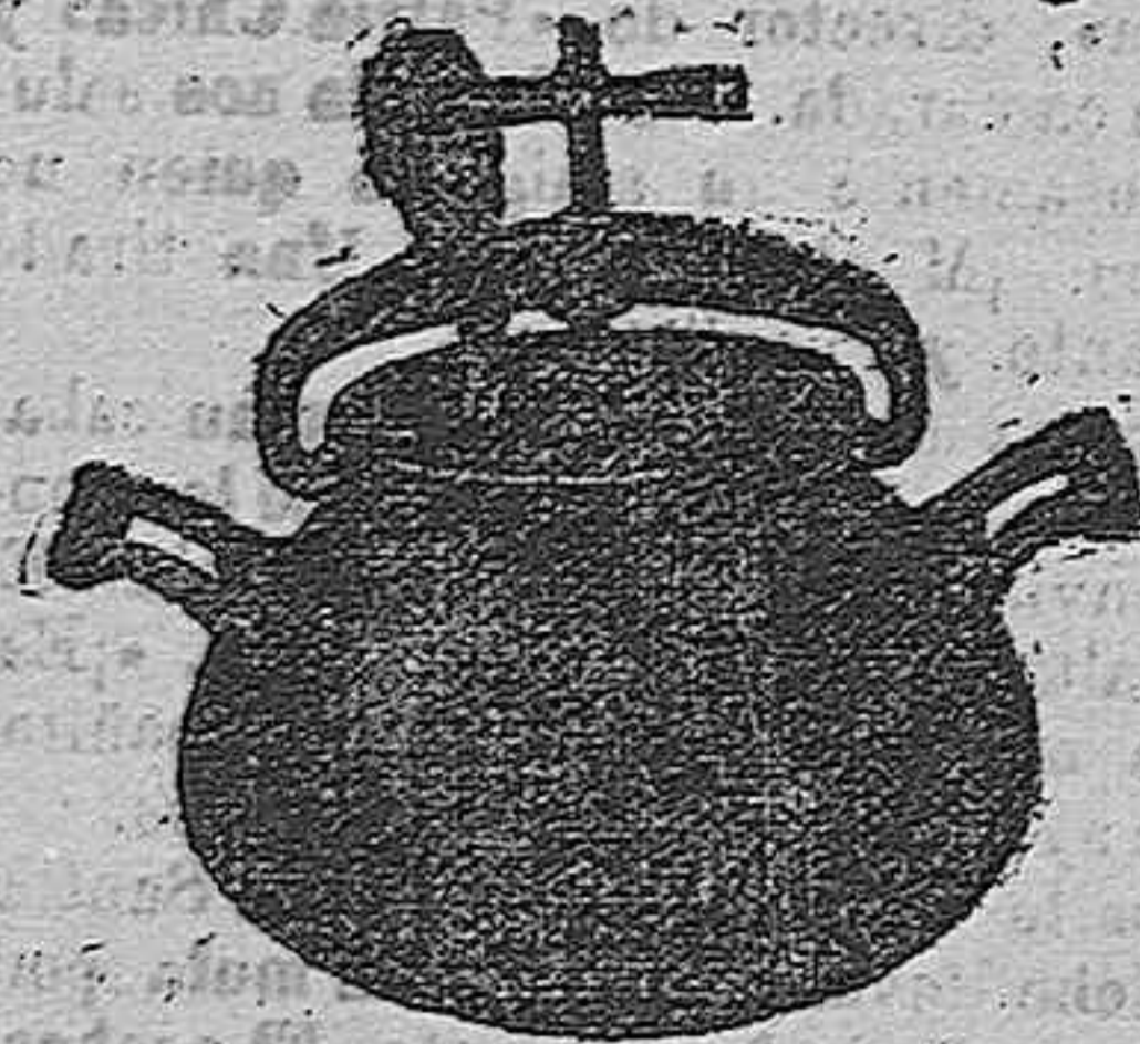
Marmita Hispano-Olla Exprés

Batería de cocina - Herrajes para obras y herramientas en general