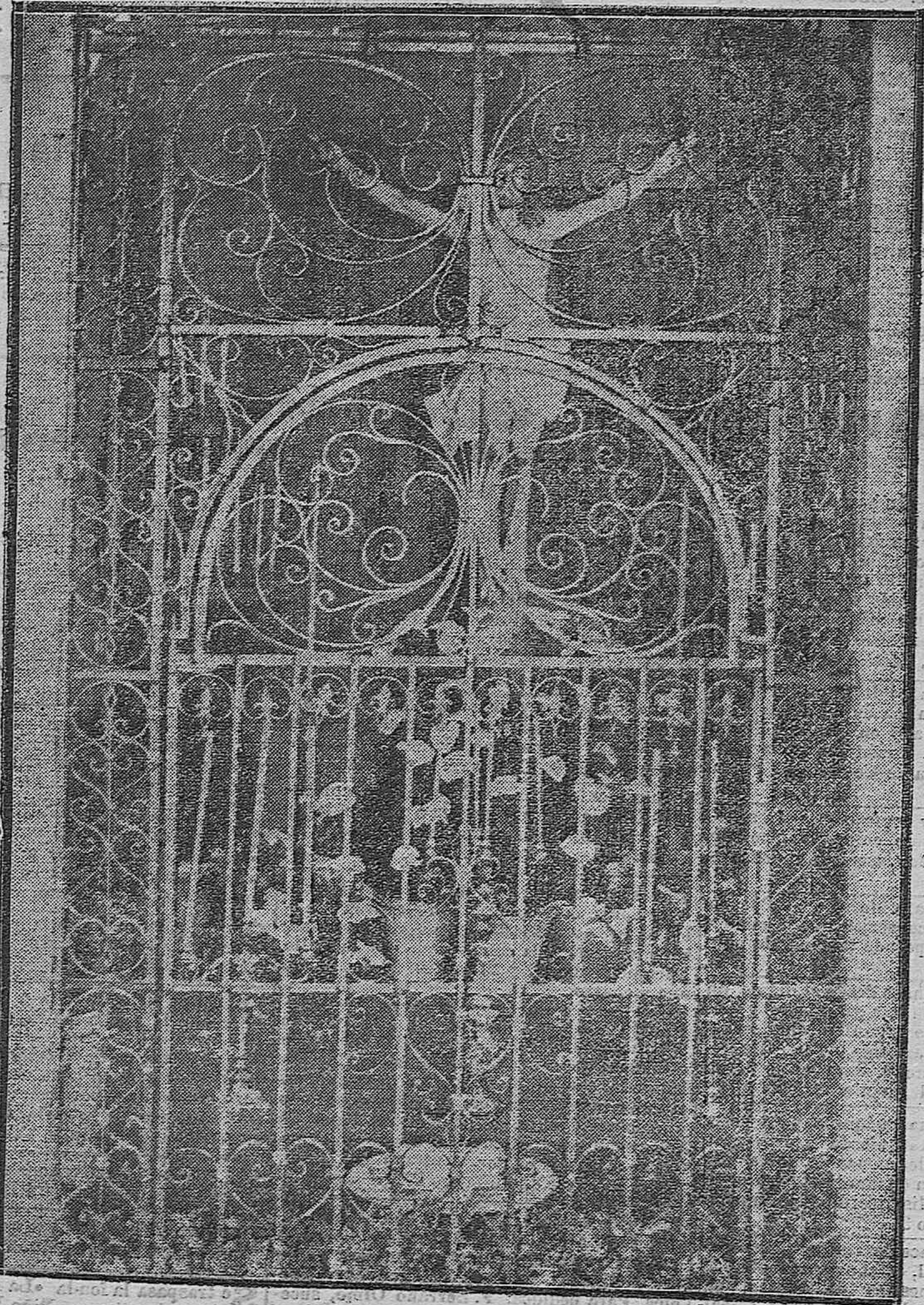
EL CONCURSO DE ALTARES. —El originalísimo y artístico altar levantado en la Casa del Niño, que mereció el primer premio.