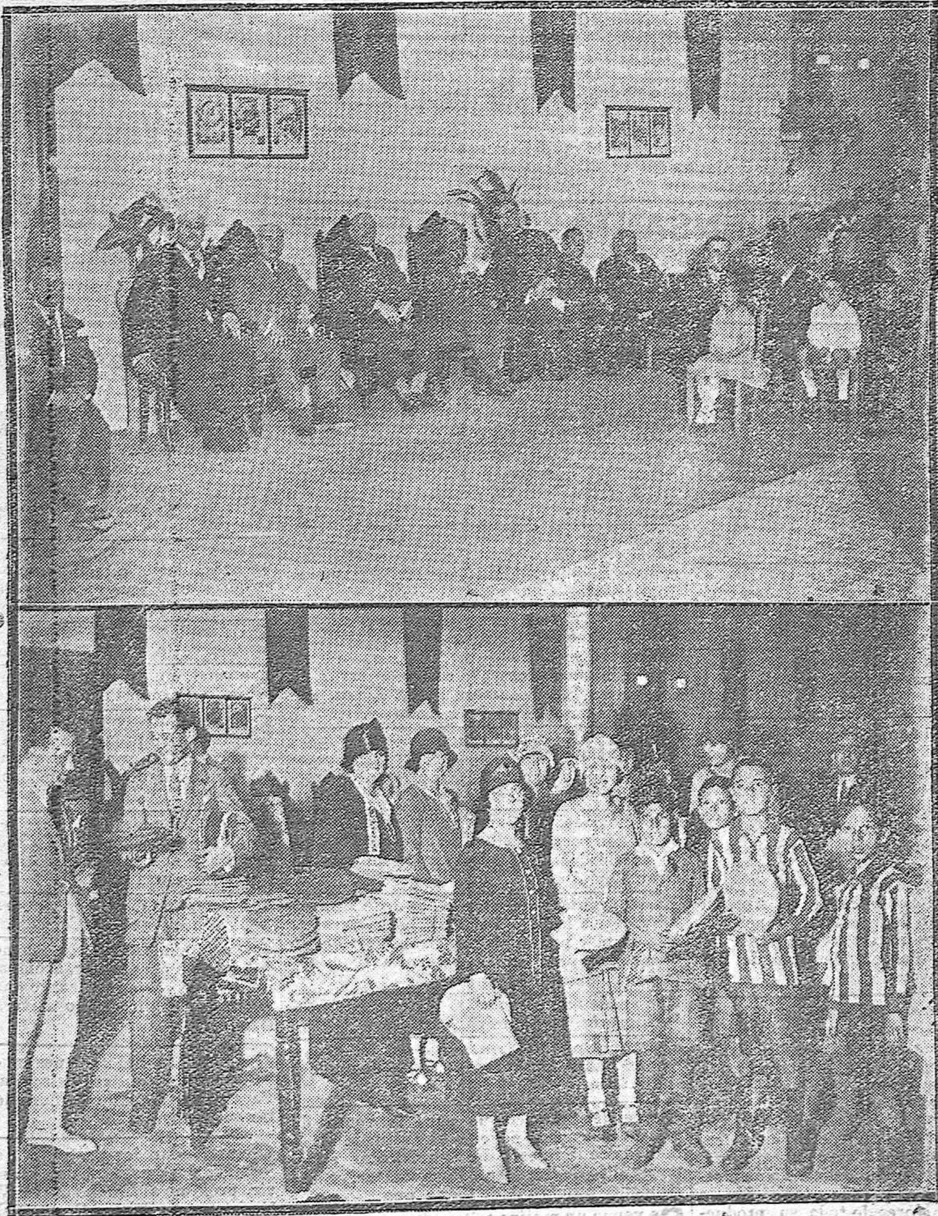
1) Las autoridades presenciando las fiestas Salesianas celebradas con motivo del reparto de premios. 2) Distinguidas damas y señoritas durante el reparto.