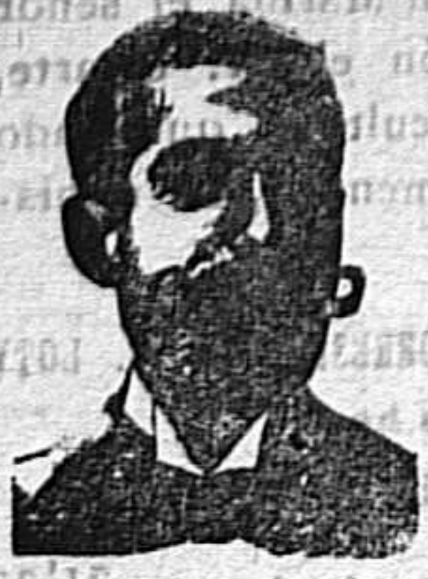
A. SALVATI COSTANZI Calle Diputación, 435—Barcelona