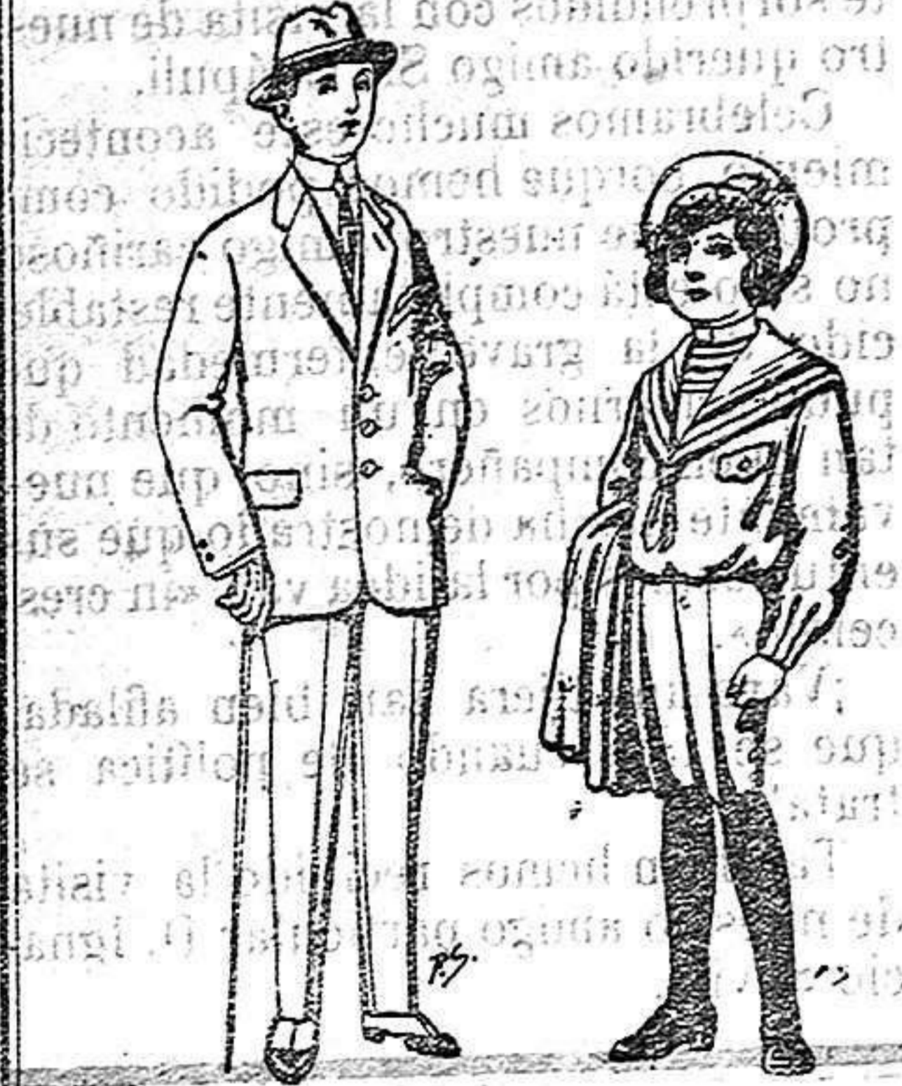
Trajes paten, vi-cuña o jerga para niños de 10 a 16 años. De 14 a 50 ptas. Trajes de jerga negra o azul para niños de 4 a 9 años. De 5 a 10 ptas