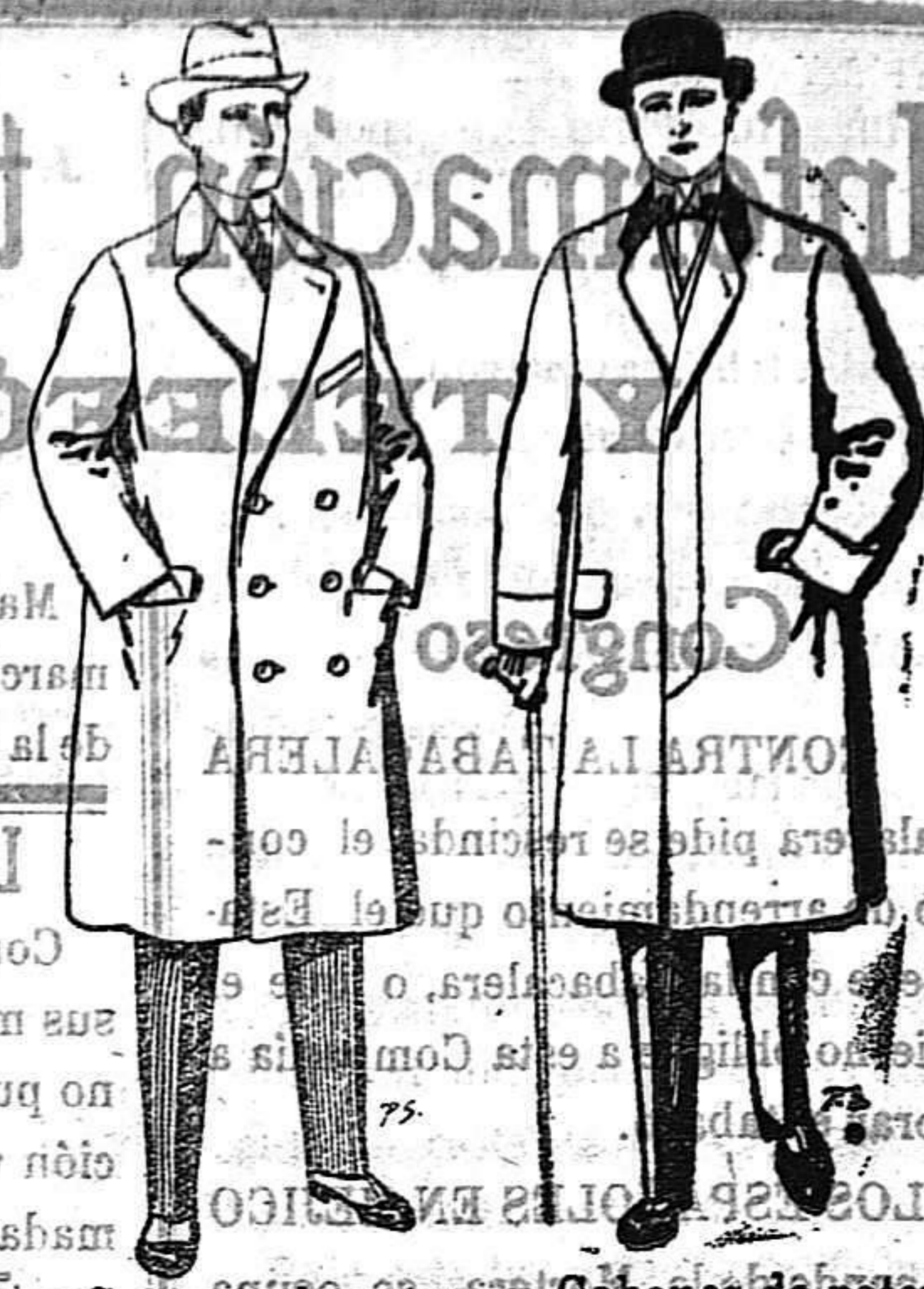
Gabanes de paten cheviot etc. De 55 a 105 ptas. Gabanes de paten melton o cheviot. De 25 a 100 ptas.