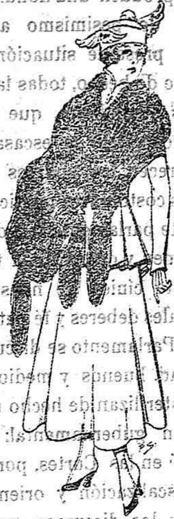
Juego de pieles imitación perfecta al renard negro. De 40 a 45 ptas.