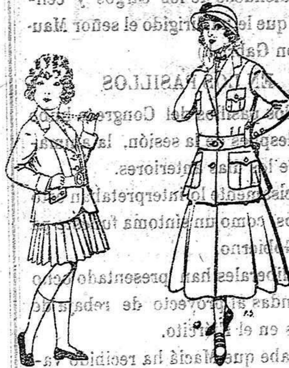
Trajes de lanilla para niñas de 4 a 11 años. De 20 a 35 ptas. Trajes de lana para jovencitas de 13 a 16 años. De 40 a 45 ptas.