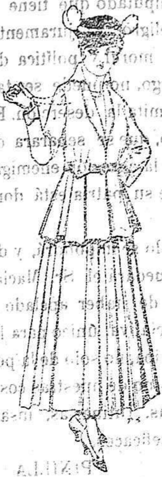
Trajes de lana negra, azul y color para señora. A 85 ptas.

Peletería, Camisería, Géneros de Punto, Corbatería, Guantería, Sombrerería, Zapatería, Paraguas, Bastones y Artículos de Viaje.