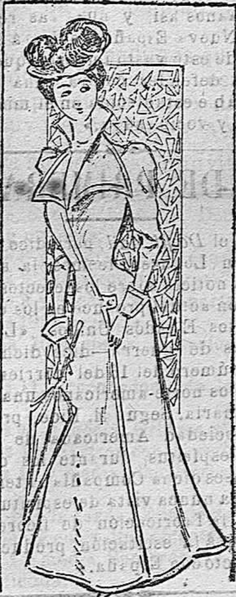
ABRIGO PARA VIAJE

De seda beige; cuerpo abierto sobre un canesú de raso cubierto de guipur; cuello de guipur y ruxa de gasa; mangas lisas y falda adornada de raso, formando delantal y con rulos de raso en el borde.